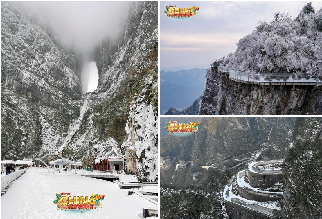
(หมายเหตุ: ทางเดินกระจก เปิด-ปิด ให้บริการจะขึ้นอยู่กับสภาพอากาศ)

จากนั้น นำท่านเดินทางสู่ เขาเทียนเหมินซาน เป็นภูเขาชื่อแห่งแรกที่ได้บันทึกไว้ในจดหมายเหตุประวัติศาสตร์ของเมืองจางเจี๋ย เนื่องจากหน้าผาสูงชันมีช่องโพรงลักษณะคล้ายประตู ช่องหินเทียนเหมิน (ประตูสวรรค์) ที่มีทัศนียภาพแปลกมหัศจรรย์และพบเห็นได้น้อยมากในโลกปัจจุบัน และขึ้นสู่ ยอดเขาเทียนเหมินซาน (โดยรถโค้ชของอุทยาน) และต่อกระเช้าขึ้นไปชมความงามของภูเขานับร้อยยอดที่สูงเสียดฟ้า ระหว่างทางตื่นตาตื่นใจไปกับ “ถนน 99 โค้ง” เส้นทางขึ้นเขาเลาะหน้าผาที่มีโค้งมากถึง 99 โค้งจากบนกระเช้า ทัศนียภาพของ “หน้าผาลอยฟ้า” ที่งดงามที่สุดแห่งหนึ่ง พร้อมกับทำทหายความหวาดเสียวของทางเดินกระจกที่มีระยะทางประมาณ 60 เมตร