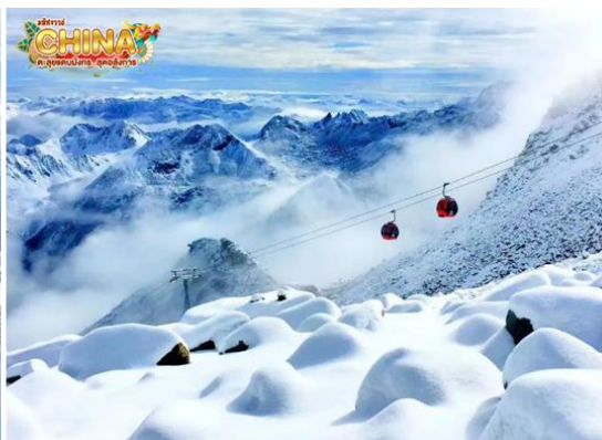
(หมายเหตุ: ปริมาณหิมะขึ้นอยู่กับสภาพอากาศ)