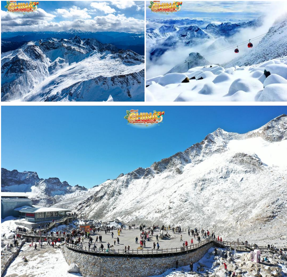
(หมายเหตุ: ปริมาณหิมะขึ้นอยู่กับสภาพอากาศ)

กลางวัน 🍽️ บริการอาหารกลางวัน ณ ภัตตาคาร