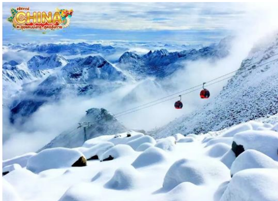
(หมายเหตุ: ปริมาณหิมะขึ้นอยู่กับสภาพอากาศ)

นำท่าน นั่งเคเบิลคาร์ เพื่อเดินทางขึ้นไปยัง จุดสูงสุดของภูเขาที่มีความสูง 4,860 เมตร ระหว่างทางขึ้นคุณ จะได้เห็นภาพของทัศนียภาพของภูเขาน้ำแข็งที่เชื่อว่าเป็น สันหลังของมังกรอันงดงามชมภูเขาน้ำแข็งหิมะ