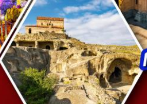
เมืองด้าอ์พลิสตีเคห์

แพ็คเกจ Rooms Hotel โรงแรมวิวทิวทัศน์ของเทือกเขาคอเคซัส