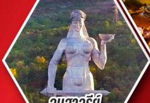
อนุสาวรีย์ มารดาแห่งจอร์เจีย