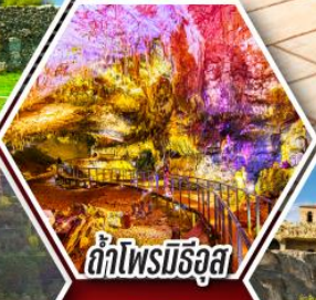
ด้าไฟร์บิลจูล