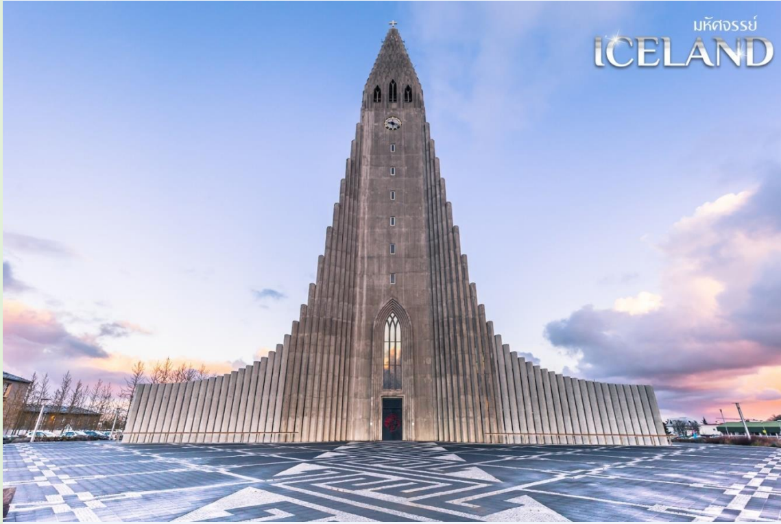
มหัศจรรย์ ICELAND

หลังจากที่ได้ชมธรรมชาติรอบเกาะกันอย่างจุใจแล้ว พาท่านชมความงามของสถาปัตยกรรมแปลกตาในเมืองหลวง โดยเริ่มกันที่ โบสถ์ฮัลล์กริมสคิร์คยา (Hallgrímskirkja) แลนด์มาร์กสำคัญของเมือง สร้างขึ้นในปี 1945 ตัวโบสถ์มีความสูง 73 เมตร รูปแบบสถาปัตยกรรมได้รับแรงบันดาลใจมาจากน้ำตก Svartifoss ซึ่งจะมีหินบะซอลต์อยู่ทั้ง 2 ข้างของน้ำตก