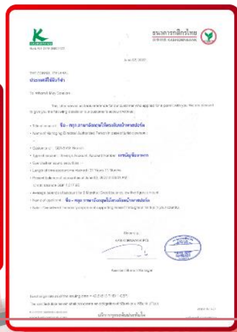
ตัวอย่าง Bank Guarantee ที่ผู้สมัครต้องขอจากธนาคาร

** ชำระค่าทัวร์ในนามบริษัท ไลออน ทราเวล จำกัด เท่านั้น **