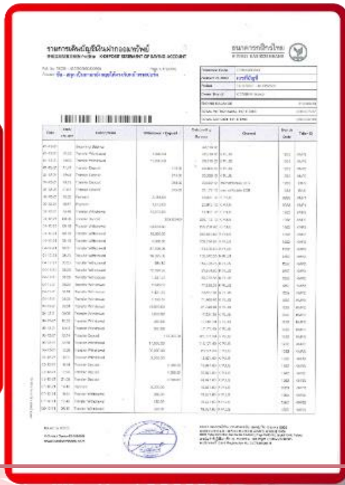
ตัวอย่าง Bank Statement ที่ผู้สมัครต้องขอจากธนาคาร

3.4 ปรับสมุดบัญชีธนาคารตัวจริง และเตรียมไปในวันที่ยื่นวีซ่า