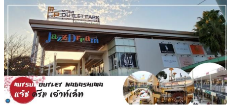
MITSUI OUTLET NAGASHIMA แจ๊ซ ดรีม เอ้าท์เล็ต

สถานที่ที่รวบรวมสินค้าแบรนด์เนม และสินค้าแบรนด์ญี่ปุ่น โกอินเตอร์มากมายกว่า 240 ร้านค้ามากที่สุดในประเทศ ให้ท่านได้เลือกซื้อสินค้าเสื้อผ้า อาทิ MK Michel Klein, Morgan, Ecco, United Colours of Benetton, Lacoste ฯลฯ กระเป๋า Bally, Coach, Gucci, Gap, Armani เลือกดูเครื่องประดับ และนาฬิกาอย่าง G-Shock, Seiko, Tag Heuer, Agete, S.T. Dupont, Tasaki, Longines ฯลฯ รองเท้าแฟชั่นและกีฬา Adidas, Nike, Kappa, Hush Puppies ฯลฯ และสินค้าอื่นๆ อีกมากมายซึ่งอยู่ในพื้นที่เดียวกันทั้งหมด