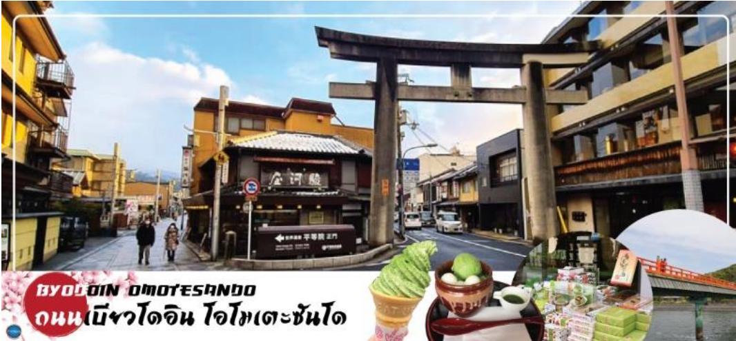
BYODON OMOOTESANDO ถนนเมียวไดอิน ไอโตะเตะซันโด

กาชาปอง, ตู้อิสกริม, และตุ๊กตน้ำ ที่ไซโทนสีให้เข้าชิมถนนชาเขียวรวมถึงน้ำและขนมในตุ๊กตก็เป็นรสชาเขียวทั้งหมด เมื่อท่านเดินทางสุดถนนแล้ว จะเจอ สะพานอุจิ (Uji Bridge) หนึ่งในสามสะพานเก่าแก่ที่สุดในญี่ปุ่น สร้างขึ้นในปี ค.ศ. 646 อายุคร่าวๆ ประมาณ 1,370 ปี เกือบพังทลายมาแล้วหลายครั้งจากสงคราม น้ำท่วม และแผ่นดินไหว แต่ทุกครั้งชาวเมืองก็ร่วมพลังกันซ่อมแซมจนกลับมาใช้งานได้อีกครั้งและยึดหยึดมาจนถึงวันนี้ กลายเป็นมรดกทางประวัติศาสตร์ของชาวเมืองอุจิ