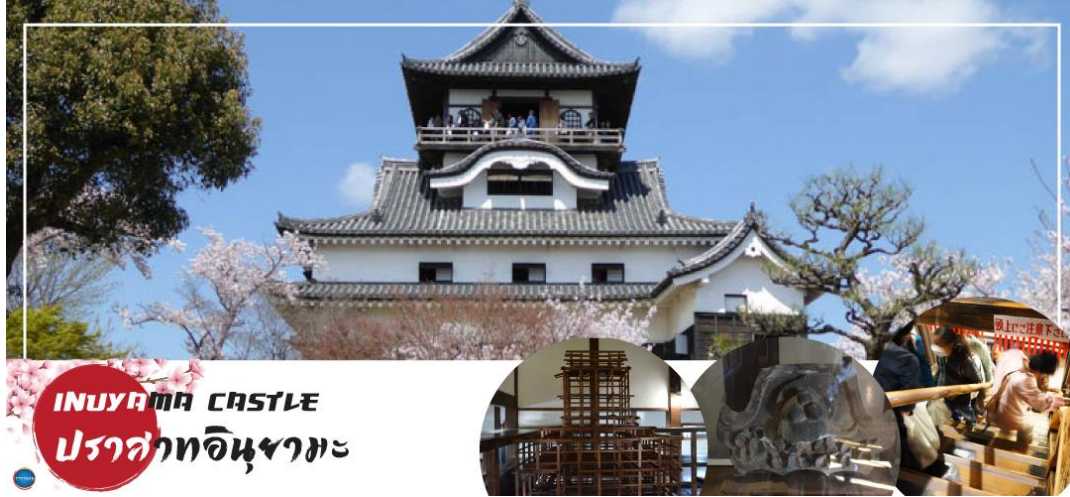
INUYAMA CASTLE ปราสาทอินูยามะ

วันที่สาม เมืองนาโกย่า – เมืองอินูยามะ – ปราสาทอินูยามะ(เข้าชม) (จุดชมซากุระขึ้นกับคู่มืออากาศ) – ศาลเจ้าซังโคอินาริ – ย่านเมืองเก่าอินูยามะโจคามาจิ – เมืองกิฟุ – หมู่บ้านมรดกโลกชิราคาวาโกะ – เมืองทาคายามะ – ออนเซ็น