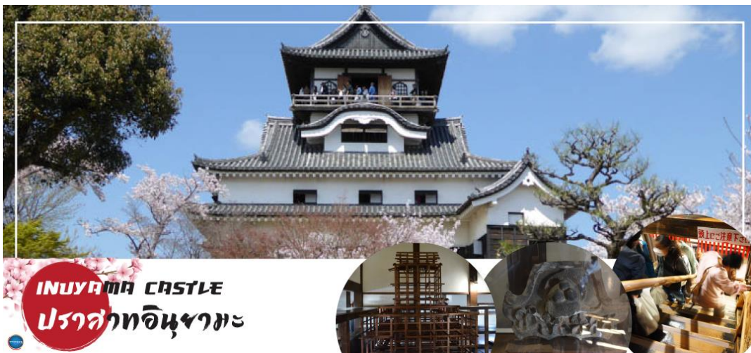
INUYAMA CASTLE ปราสาทอินูยามะ

วันที่สอง ท่าอากาศยานนานาชาติซูเซ็นแทรร์ นาโกย่า – เมืองอินูยามะ – ปราสาทอินูยามะ(เข้าชม) – ศาลเจ้าซังโคอินาริ – ย่านเมืองเก่าอินูยามะโจคามาจิ – เมืองกิฟุ – อีออน มอลล์