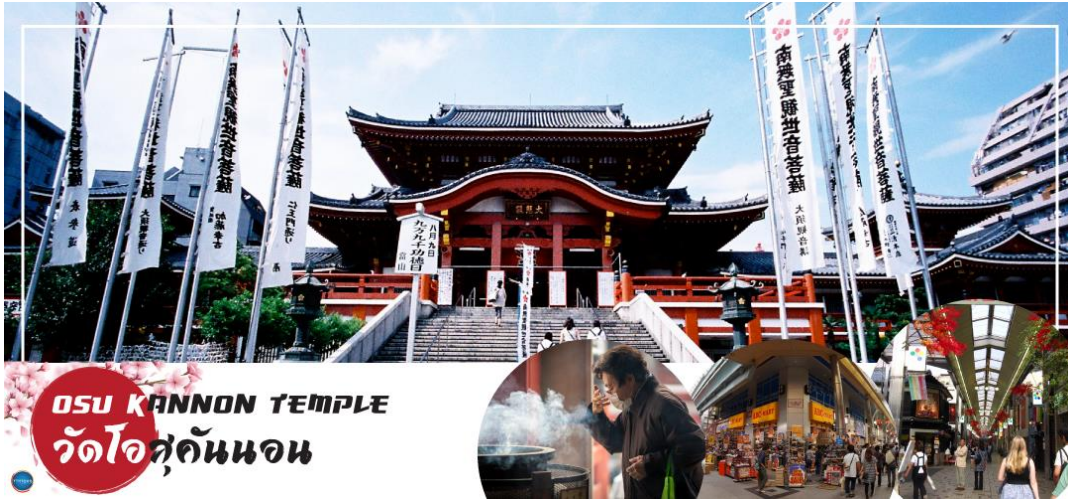
OSU KANNON TEMPLE วัดโอสถคันนอน

วันที่สี่ เมืองนาโกย่า – วัดโอสถคันนอน – ถนนช้อปปิ้งโอส – แจ๊ซ ดรีม เอ๊าท์เล็ท – ชมงานประดับไฟฤดูหนาว ณ หมู่บ้าน นานาโนะ โนะ ซาโตะ