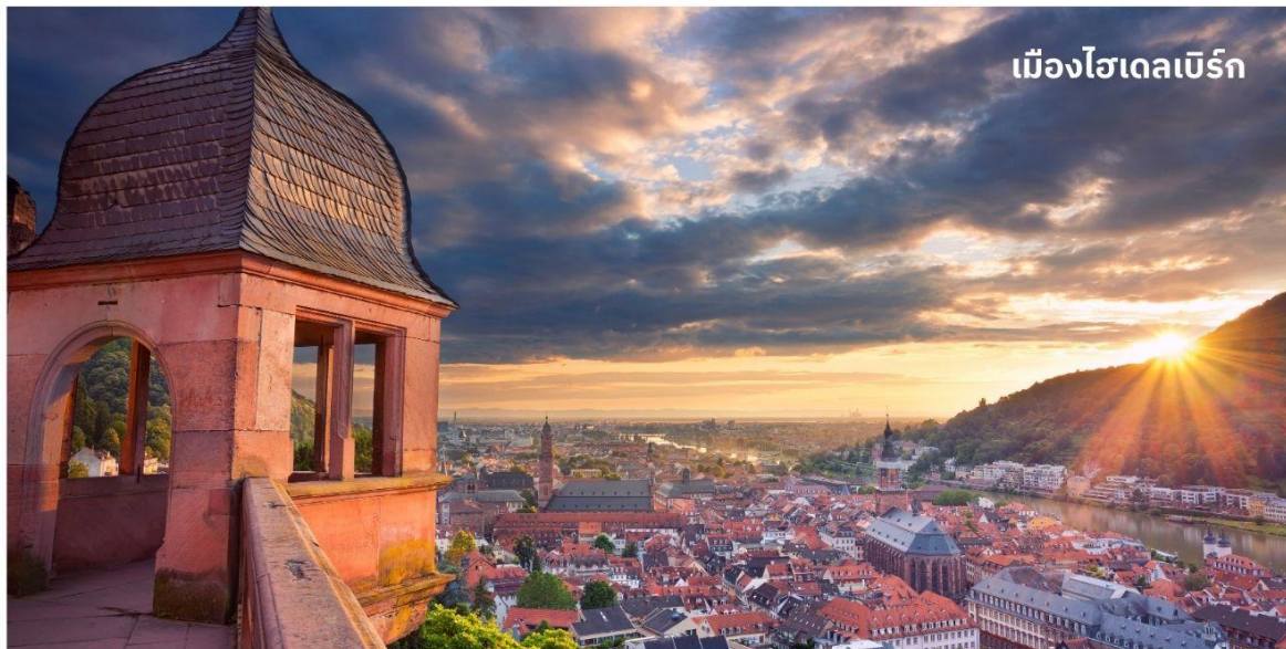
เมืองไฮเดลเบิร์ก

** ชำระค่าทัวร์ในนามบริษัท ไลออน ทราเวล จำกัด เท่านั้น **