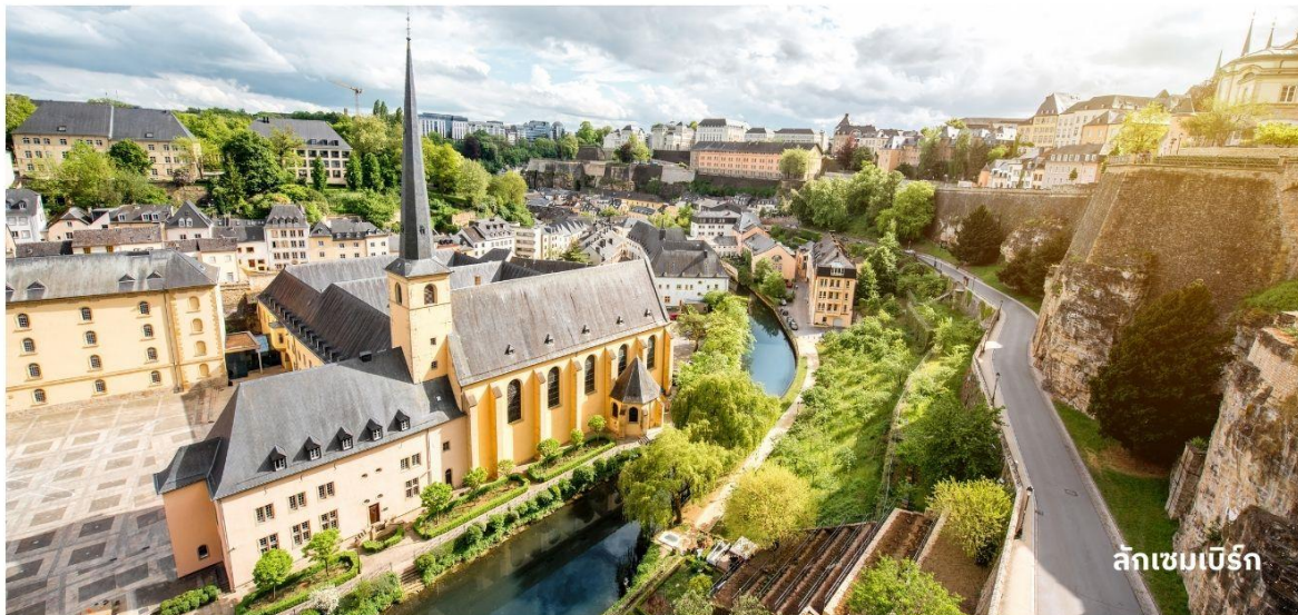
ลักเซมเบิร์ก

นำท่านถ่ายรูปด้านหน้า มหาวิหารนอเทรอดาม ซึ่งเป็นมหาวิหารโรมันคาทอลิก ตกแต่งด้วยสถาปัตยกรรมแบบโกธิคผสมกับเรอเนซองส์ โดดเด่นแปลกตาที่สุดแห่งหนึ่งในยุโรป จากนั้นนำท่านถ่ายรูปด้านหน้า Palace of the Grand Dukes เป็นที่อยู่อาศัยอย่างเป็นทางการของแกรนด์ดยุกแห่งลักเซมเบิร์ก