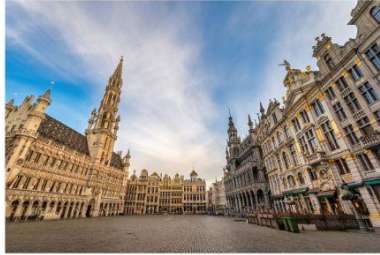
รูปปั้นแมนเนกันพิส