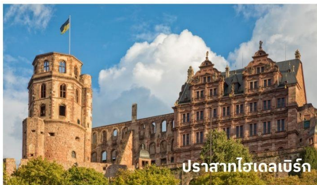
ปราสาทไฮเดลเบิร์ก

จากนั้นนำท่าน เข้าชมปราสาทไฮเดลเบิร์ก ตั้งอยู่บนเนินเขาโดยรอบมีป่าละเมาะแสนสวยให้นักท่องเที่ยวสามารถเดินเล่นได้ บริเวณปาร์กของปราสาทจะมีต้นไม้ใหญ่อ่างต้นเมิช ต้นเมเปิ้ล ต้นโอ๊ค เมื่อขึ้นไปอยู่บนเนินเขาที่ตั้งของปราสาทจะมีจุดชมวิวที่จะมองลงไปดูตัวเมืองเก่าไฮเดลเบิร์ก และยังเห็นแม่น้ำเนคคาร์ ที่ไหลผ่าน ตัวเมืองไฮเดลเบิร์กอีกด้วย