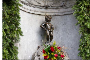
รูปปั้นแมนเนกันพิส