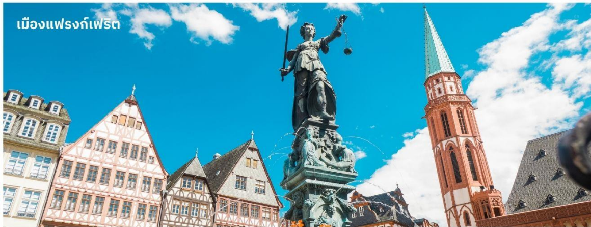
เมืองแฟรงก์เฟิร์ต

** ชำระค่าทัวร์ในนามบริษัท ไลออน ทราเวล จำกัด เท่านั้น **