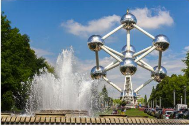
อะตอมเมียม