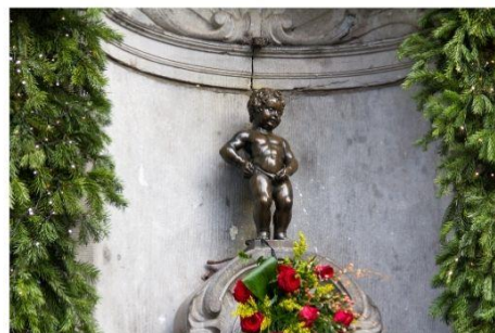
รูปปั้นแมนเนเก็นพิช

นำท่านไปชม รูปปั้นแมนเนเก็นพิช รูปปั้นเจ้าหนูน้อยที่โด่งดัง อีสาระให้ท่านเดินเล่นชมเมืองหรือเลือกซื้อสินค้าของเมืองอาทิ ช็อคโกแลต เบลเยียมผลิตช็อคโกแลตกว่า 172,000 ตันต่อปี และมีร้านขายช็อคโกแลตกว่า 2,000 ร้าน, ฝาปกลูกไม้หรือลิ้มลองวาฟเฟิลของอร่อยที่หาชิมได้ไม่ยาก