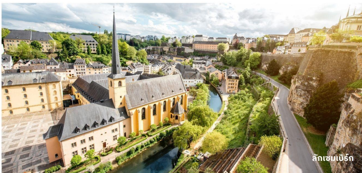
ลักเซมเบิร์ก

จากนั้นนำท่านเดินทางสู่ ประเทศลักเซมเบิร์ก ใช้เวลาเดินทางประมาณ 3.30 ชั่วโมง ประเทศเล็กๆ ตั้งอยู่ใจกลางของยุโรป เป็นหนึ่งในประเทศที่ผู้คนมีความร่ำรวย ไม่ใช่เพียงเงินเท่านั้นแต่ที่นี้ยังร่ำรวยไปด้วยวัฒนธรรม ประวัติศาสตร์และธรรมชาติที่สวยงาม จากนั้นนำท่านเที่ยว ชมย่านเขตเมืองเก่า สถานที่ที่มีความสวยงามและล้ำค่าทางประวัติศาสตร์