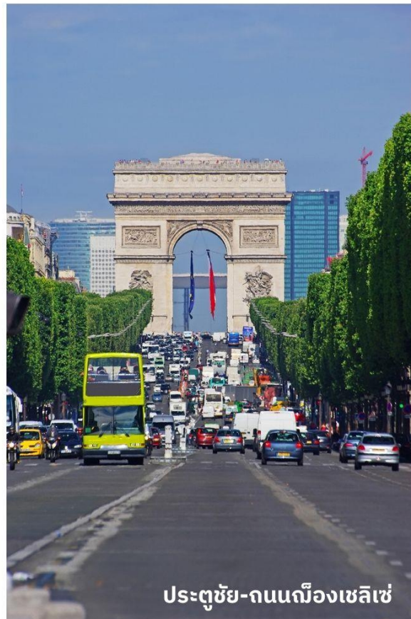
ประตูชัย-ถนนฌ็องเซลิเซ่

บริการอาหารกลางวัน ณ ภัตตาคาร จากนั้นนำท่านเดินทางท่องเที่ยวตามสถานที่ ที่มีชื่อเสียงของกรุงปารีส