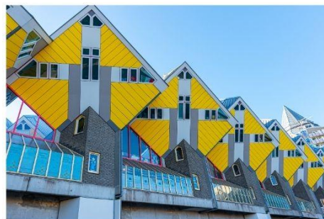
บ้านลูกเต๋าคูบัส

นำท่านถ่ายรูปกับ บ้านลูกเต๋าคูบัส (Kijk Kubus The Cubic Houses) กลุ่มอาคารเหล็องชาวทรงลูกเต๋า 39 หลัง ซึ่งได้รับรางวัลชนะเลิศการออกแบบสาขาประหยัดพลังงาน โดยสถาปนิกนาม Piet Bloem