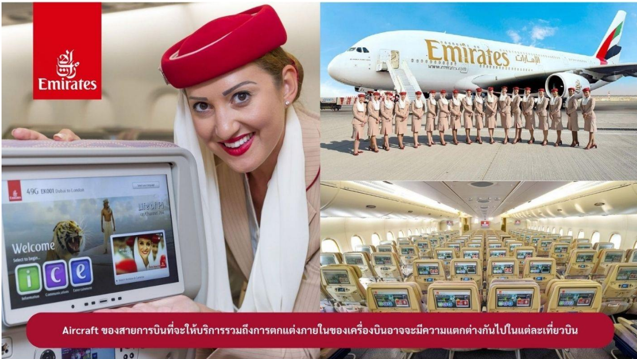
Aircraft ของสายการบินที่จะให้บริการรวมถึงการตกแต่งภายในของเครื่องบินอาจมีความแตกต่างกันไปในแต่ละเที่ยวบิน

** ชำระค่าทิวรีในนามบริษัท ไลออน ทราเวล จำกัด เท่านั้น **