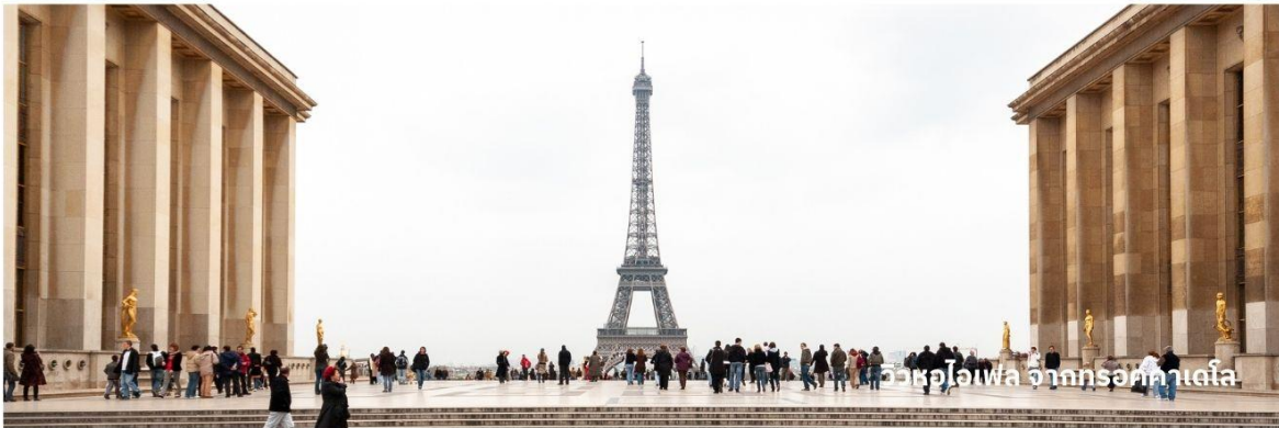
วิวหอไอเฟล จากทรอกาเดอโร

** ชำระค่าทัวร์ในนามบริษัท ไลออน ทราเวล จำกัด เท่านั้น **