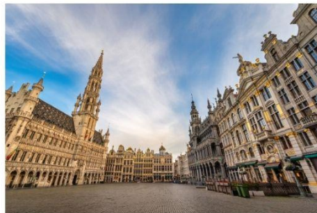
จัตุรัสกรองปลาช

จากนั้นนำท่านสู่ จัตุรัสกรองปลาช จตุรัสอันงดงามที่สุดแห่งหนึ่งของยุโรป ได้รับการยกย่องจากนักท่องเที่ยวทั่วโลก หรือแม้แต่อาร์คดัชเชสอริสซาเบลลา ธิดาของกษัตริย์ฟิลิปที่ 2 แห่งสเปน, วิกเตอร์ ฮูโก และชาร์ลส โบเดอแลร์ สองนักเขียนชื่อดังยกกล่าวถึง