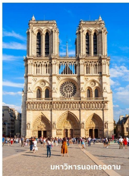
มหาวิหารนอเทรอดาม

ซึ่งเป็นมหาวิหารโรมันคาทอลิก ตกแต่งด้วยสถาปัตยกรรมแบบโกธิคผสมกับเรอเนซองส์ โดดเด่นแปลกตาที่สุดแห่งหนึ่งในยุโรป จากนั้นนำท่านถ่ายรูปด้านหน้า Palace of the Grand Dukes เป็นที่อยู่อาศัยอย่างเป็นทางการของแกรนด์ดยุคแห่งลักเซมเบิร์ก