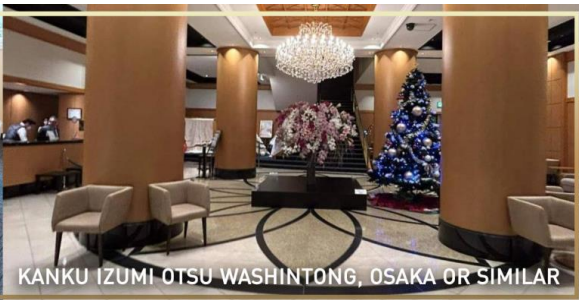
KANKU IZUMI OTSU WASHINTONG, OSAKA OR SIMILAR