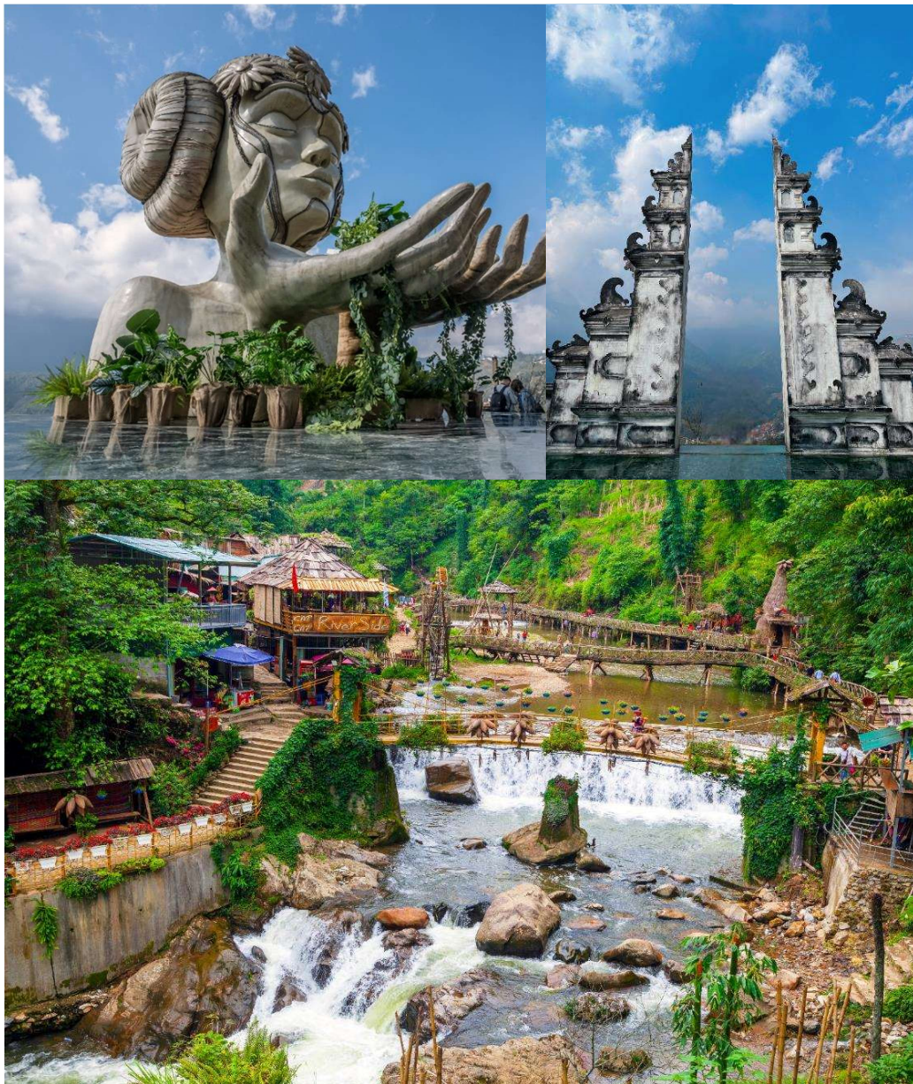
T2G-HAN01TG ชินจ่าว เวียดนาม... ซาปา ฟานสิปิน ฮานอย นิงหิงห์ 4 วัน 3 คืน (TG)

จากนั้นนำท่านเดินทางต่อนำท่านสู่ โมอาน่า (Moana Sapa Cafe) จุดเช็คอินแห่งใหม่ของเมืองซาปา คล้ายกับประตูสวรรค์ที่บาหลี ให้ท่านได้ถ่ายรูปเก๋ๆกับมูมน่ารักๆ เช่น บันไดมือ มุมเล่นชิงช้า มุมเล่นเปียโน หรือ โชนั่งพักผ่อนต้นไม้ที่สามารถมองวิวได้จากมุมสูง เมื่อมองออกไปจะเห็นเป็นวิวภูเขาอันสวยงาม นอกจากนี้ยังมีเครื่องดื่มจำหน่าย ให้ท่านได้ลิ้มรสกับบรรยากาศสุดฟินตามอัธยาศัย