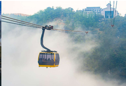
T2G-HAN01TG ขึ้นจำว เวียดนาม... ซาปา ฟานสิปัน ฮานอย นิงห์บิงห์ 4 วัน 3 คืน (TG)

** ชำระค่าทัวร์ในนามบริษัท ไลออน ทราเวล จำกัด เท่านั้น **