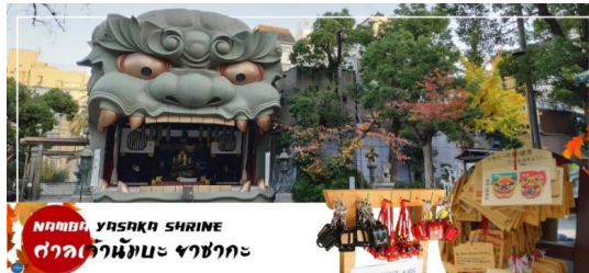
NAMBA YASAKA SHRINE ศาลเจ้านัมมะ ยาซากะ

นำทุกท่านเช็คอินจุดถ่ายรูปที่ ศาลเจ้านัมมะยาซากะ (Namba Yasaka Shrine) ตั้งอยู่ในย่านนัมมะของเมืองโอซาก้า ไฮไลท์ของศาลเจ้าแห่งนี้ คือรูปปั้นหน้าสิงโตอ้าปากขนาดใหญ่ ที่เชื่อกันว่า สามารถกลืนกินปีศาจร้าย หรือ สิ่งไม่ดีทั้งหลายให้หายไป และนำพามาซึ่งความโชคดีให้แก่ผู้คน ปัจจุบันนักเรียน นักศึกษาและผู้ประกอบการธุรกิจนั้น นิยมมาขอพรให้ประสบความสำเร็จกันที่นี่ ด้วยความสูง 17 เมตร ความกว้าง 11 เมตรและความลึก 7 เมตร อีสระให้ทุกท่านสักการะ และเก็บภาพที่ ศาลเจ้านัมมะ ยะชะกะ