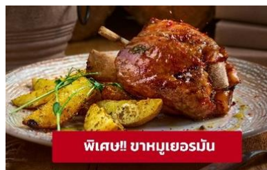
พิเศษ!! ขาหมูเยอรมัน

Highlight! เมื่อถึงที่ต้องได้ชิม ขาหมูเยอรมัน (German Pork Knuckle) เมนูที่โด่งดังทั่วโลกและเป็นเมนูโปรดของใครหลายๆ คน