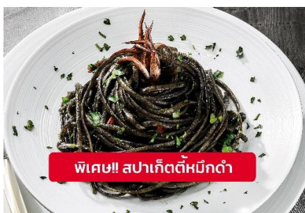
พิเศษ!! สปาเก็ตตี้หมึกดำ

Highlight! เมื่อเยือนเกาะเวนิส เมนูที่ขึ้นชื่อและหากได้มาต้องได้ลิ้มลอง สปาเก็ตตี้หมึกดำที่คลุกเคล้ากับความหอมนุ่มนวลกับบรรยากาศ