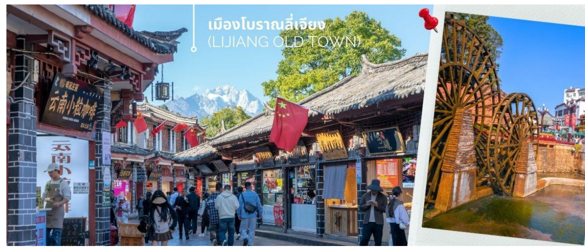
เมืองโบราณลี่เจียง (LIJIANG OLD TOWN)

นำท่านเดินทางชม เมืองโบราณลี่เจียง (LIJIANG OLD TOWN) หรือ เมืองโบราณต้าเอี้ยนเจิ้น เมืองเก่าแก่อายุกว่า 800 ปี ซึ่งภายในเมืองเก่านั้นยังคงมีสถาปัตยกรรมบ้านเรือนสไตล์จีนเก่าแก่ที่หาชมได้ยาก และได้รับการอนุรักษ์ไว้เป็นอย่างดี บางหลังเหมือนโรงเตี๊ยมโบราณที่เคยเห็นตามหนังจีนย้อนยุค บ้านเรือนส่วนใหญ่ถูกปรับเปลี่ยนให้กลายมาเป็น