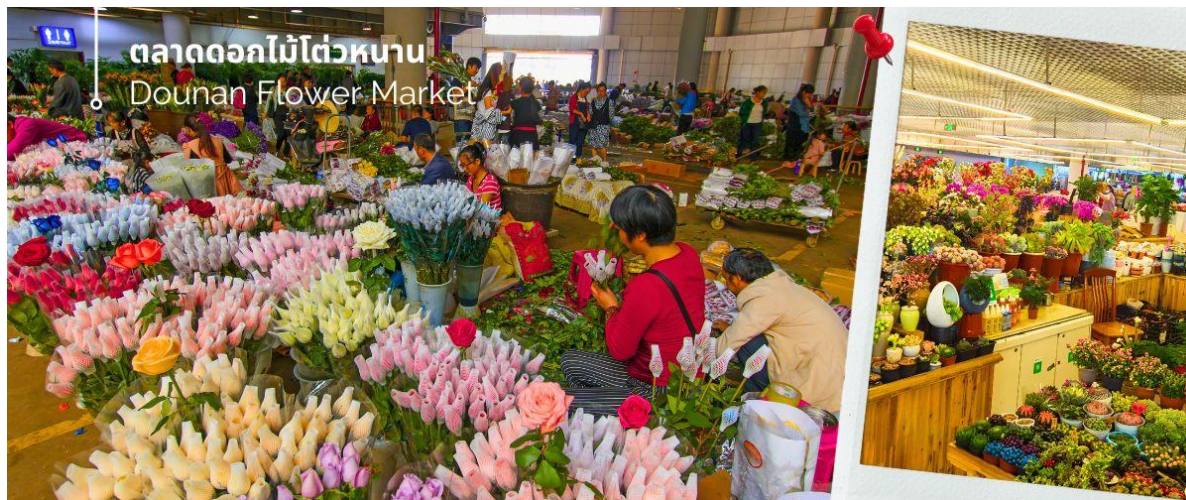
ตลาดดอกไม้ไต้หวัน Dounan Flower Market

นำท่านชม ตลาดดอกไม้ไต้หวัน เป็นตลาดค้าส่งดอกไม้ที่ใหญ่ที่สุดของจีน เปิดทำการค้าตลอด 24 ชั่วโมง ไม่มีช่วงเวลาปิดทำการ โดยในปี 2566 ตลาดดอกไม้ไต้หวันมีปริมาณการซื้อขายดอกไม้โดยเฉลี่ยรวม 13,540 ล้านบาท คิดเป็นมูลค่า 13,570 ล้านบาท ถือเป็นตลาดค้าปลีก-ส่ง ผลผลิตทางการเกษตรที่ใหญ่ที่สุดในประเทศจีนอีกด้วย