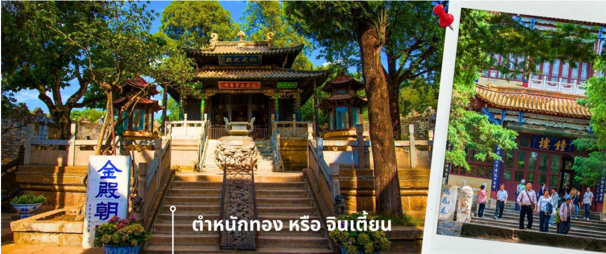
ตำหนักทอง หรือ จินเตี้ยน

นำท่านเยี่ยมชม ตำหนักทอง หรือ จินเตี้ยน (The Golden Temple Park | Jindian park) (ไม่รวมค่ารถแบตเตอรี่ 10 หยวน/ท่าน) โบราณสถานสำคัญของมณฑลยูนนาน ที่ได้รับการปกป้องดูแลโดยรัฐบาลจีน ตั้งอยู่บริเวณเชิงเขาหมิงเฟิง ล้อมรอบด้วยแนวกำแพงและหอคอยเหมือนเป็นป้อมปราการ ตำหนักทองถูกเรียกตามลักษณะอาคารที่มีสีทองอร่าม จากทองเหลืองในส่วนของผนังและหลังคา รวมกว่า 200 ตัน โดยถือเป็นสิ่งปลูกสร้างสัมฤทธิ์ที่ใหญ่ที่สุดของจีน ภายในมีรูปปั้นทองโดยมีเงินอยู่ (เสวียนอู) เทพเจ้าลัทธิเต๋าเป็นองค์ประธาน