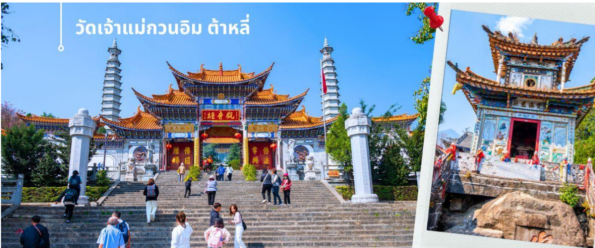
วัดเจ้าแม่กวนอิม ต้าหลี่

นำท่านชม วัดเจ้าแม่กวนอิม (ใช้เวลาเดินทาง 30 นาที) ตามตำนานเล่าว่าเจ้าแม่กวนอิมได้แปลงกายเป็นหญิงชราแบกก้อนหินใหญ่ไว้บนหลังเพื่อให้ทารกของฝ่ายตรงข้ามได้เห็นเมื่อทารกฝ่ายศัตรูได้เห็นว่ามีแม่แต่หญิงชรายังแข็งแรงถึงเพียงนี้ ถ้าเป็นคนวัยหนุ่มสาวจะต้องมีพลังกำลังมากมายยากที่จะต่อสู้อ จึงทำให้ไม่ทำการเข้าโจมตีเมืองและถอยทัพกลับไป ชาวเมืองจึงสร้างวัดแห่งนี้ขึ้นในสมัยราชวงศ์ถัง ซึ่งถือว่าเป็นวัดที่มีประติมากรรมยอดเยี่ยมแห่งหนึ่งในต้าหลี่ จากนั้นผ่านชม เจดีย์สามองค์ สัญลักษณ์ของเมืองต้าหลี่ ตั้งอยู่ใน วัดฉงเซี่ยง (Chongsheng Temple) วัดเก่าแก่ที่สร้างขึ้นเมื่อศตวรรษที่ 9 นับว่าเป็นหนึ่งในเจดีย์ที่สูงที่สุดในประเทศจีน