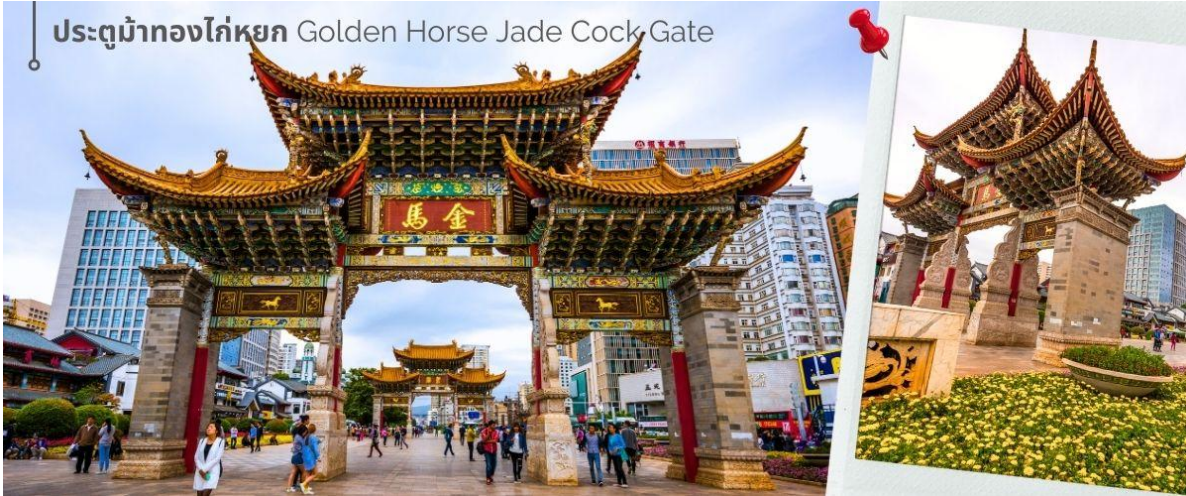
ประตูม้าทองไก่หยก Golden Horse Jade Cock Gate

ค่ำ ๑๐ รับประทานอาหารค่ำที่ภัตตาคาร (14)