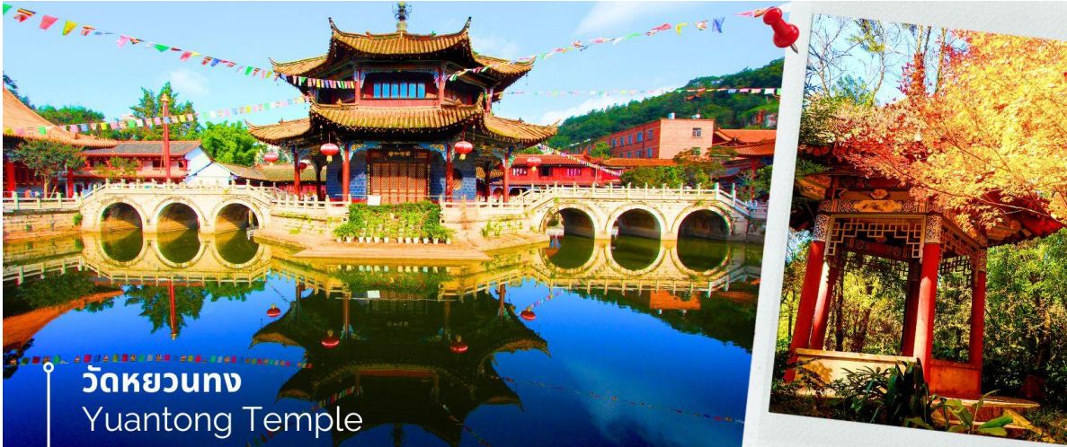
วัดหยวนทง Yuantong Temple