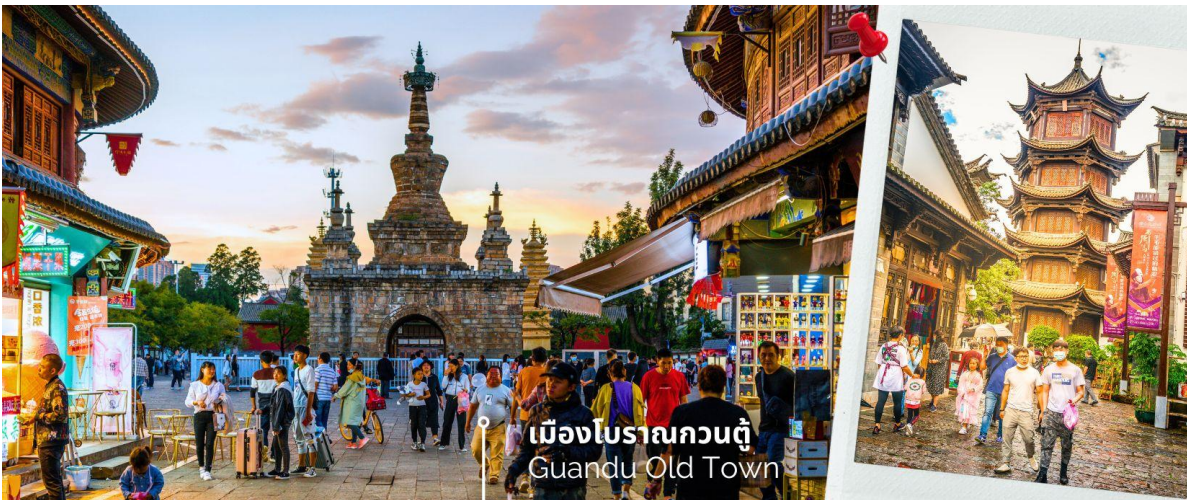
เมืองโบราณกวนตุ๋ Guandu Old Town

นำท่านชมบรรยากาศ เมืองโบราณกวนตุ๋ (Guandu Old Town) เป็นหนึ่งในต้นกำเนิดของวัฒนธรรมยูนนาน และยังถือเป็นหนึ่งในภูมิทัศน์ทางประวัติศาสตร์และวัฒนธรรม ที่สำคัญของเมืองคุนหมิง เมืองโบราณแห่งนี้ยังคงเป็นศูนย์กลางทางการค้าและคมนาคมที่สำคัญ ในอดีตเคยเป็นหมู่บ้านชาวประมงในสมัยราชวงศ์ถัง เมืองกวนตุ๋ยังเป็นเมืองแรกๆ ที่ศาสนาพุทธในทิเบตได้เริ่มเผยแพร่เข้ามาในดินแดนยูนนาน