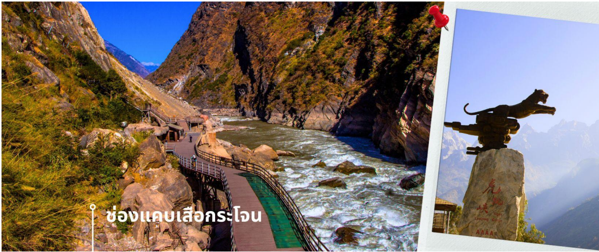
ช่องแคบเสือกระโจน

จากนั้นนำท่านแวะชม ช่องแคบเสือกระโจน (รวมค่าบริการบันไดเลื่อน ขึ้น-ลง) ซึ่งเป็นช่องแคบช่วงแม่น้ำแยงซีไหลลงมาจากจินซาเจียง(แม่น้ำทรายทอง) เป็นช่องแคบที่มีน้ำไหลเชี่ยวมาก ช่วงที่แคบที่สุดประมาณ 30 เมตร ตามตำนานเล่าว่า ในอดีตช่องแคบนี้สามารถกระโดดข้ามไปยังฝั่งตรงข้ามได้ จึงเป็นที่มาของ "ช่องแคบเสือกระโจน" ช่องเขาเสือกระโจนเป็นหนึ่งในหุบเขาเหนือแม่น้ำที่ลึกที่สุดในโลก โดยมีจุดที่ลึกที่สุดระหว่างแม่น้ำถึงยอดเขาประมาณ 3,790 เมตร บริเวณนี้มีผู้อยู่อาศัยเพียงเล็กน้อย ส่วนใหญ่เป็นชนพื้นเมืองชาวหน่าซี โดยจะอาศัยอยู่ในหมู่บ้านเล็ก ๆ บริเวณใกล้เคียง และหาเลี้ยงชีพโดยการเพาะปลูกและรับจ้างนำทางคนต่างถิ่น