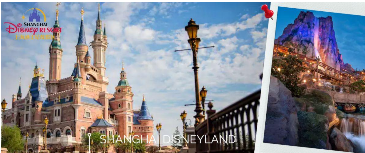
📍 SHANGHAI DISNEYLAND

นำท่านเข้าสู่ดินแดนแห่งความฝัน SHANGHAI DISNEYLAND เซี่ยงไฮ้ดิสนีย์แลนด์ แห่งนี้เป็นสวนสนุกแห่งที่ 6 ของดิสนีย์แลนด์ทั่วโลก มีขนาดใหญ่อันดับ 2 ของโลก รองจากดิสนีย์แลนด์ในออร์แลนโด รัฐฟลอริดา สหรัฐฯ และเป็นสวนสนุกดิสนีย์แลนด์แห่งที่ 3 ในเอเชีย ตั้งอยู่ในเขตฉวนซา ใกล้กับแม่น้ำหวงผู่ และสนามบินผู่ตง สวนสนุกเซี่ยงไฮ้ดิสนีย์แลนด์มีขนาดใหญ่กว่าฮ่องกงดิสนีย์แลนด์ถึง 3 เท่าเลยล่ะ ใช้เวลาร่วม 5 ปีในการก่อสร้าง โดยใช้งบประมาณทั้งสิ้นราว 5.5 พันล้านเหรียญ หรือราว 180,000 ล้านบาท สวนสนุกแห่งนี้เป็นที่พรีเซ็นของดิสนีย์ร้อยละ 43 ที่เหลือเป็นของ ชั่งไห่ เลินตี้ กรุ๊ป กิจการรัฐวิสาหกิจจีน รวมถึงภาคส่วนต่างๆ ที่อัดฉีดเงินสนับสนุนเพื่อช่วยกันแสวงหากำไรในอนาคต ในสวนสนุกจะไฮไลต์ด้วย Enchanted Storybook Castle ปราสาทดิสนีย์ที่ใหญ่ที่สุดในโลก และมีทั้งหมด 6 อิมพาร์คด้วยกัน ทั้ง Adventure Isle, Mickey Avenue, Gardens of Imagination, Tomorrowland, Treasure Cove และ Fantasyland มีสารพัดเครื่องเล่นหวาดเสียว และแหล่งรวมความบันเทิงที่น่าสนใจ ในส่วนของโรงแรมจะมี The Shanghai Disneyland Hotel เป็นโรงแรมที่ได้รับแรงบันดาลใจจากศิลปะสมัยใหม่ที่มักเปลี่ยนธีมของมนตร์ขลัง ดิสนีย์ และอีกโรงแรมชื่อ Toy Story Hotel ตกแต่งด้วยของเล่นจากการ์ตูนดิสนีย์เรื่อง Toy Story ดูน่ารักไม่แพ้กัน ที่ Disneytown ก็จะมีแหล่งช้อปปิ้ง แหล่งทานอาหาร และความบันเทิงต่างๆ อาทิ Walt Disney Grand Theatre โรงละครบรอดเวย์แห่งแรกของจีนที่เคยฉายเรื่อง Lion King ด้านโซน Wishing Star Park ก็จะเป็นสวนพฤกษชาติสวยงาม