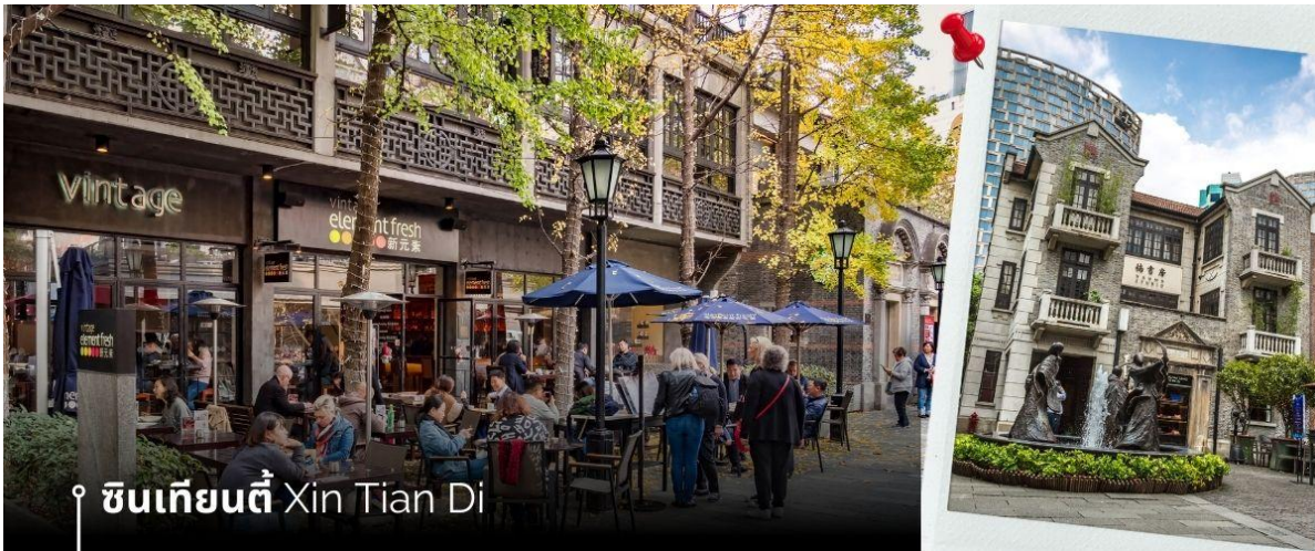
📍 ซินเทียนตี้ Xin Tian Di

ค่า 🍷 รับประทานอาหารค่ำที่ภัตตาคาร (7) เมนูพิเศษ เสี่ยวหลงเป่า 🏨 พักที่ (เมืองเซี่ยงไฮ้) Holiday Inn Express Shanghai Hotel หรือเทียบเท่า ระดับ 4 ดาว