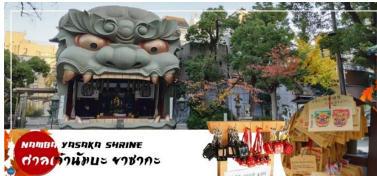
NAMBA YASAKA SHRINE ศาลเจ้านัมมะ ยาซากะ

นำทุกท่านเช็คอินจุดถ่ายรูปที่ ศาลเจ้านัมมะยาซากะ (Namba Yasaka Shrine) ตั้งอยู่ในย่านนัมมะของเมืองโอซาก้า ไฮไลท์ของศาลเจ้าแห่งนี้ คือรูปปั้นหน้าสิงโตอ้าปากขนาดใหญ่ ที่เชื่อกันว่า สามารถกลืนกินปีศาจร้าย หรือ สิ่งไม่ดีทั้งหลายให้หายไป และนำพามาซึ่งความโชคดีให้แก่ผู้คน ปัจจุบันนักเรียน นักศึกษาและผู้ประกอบการธุรกิจนั้น นิยมมาขอพรให้ประสบความสำเร็จกันที่นี่ ด้วยความสูง 17 เมตร ความกว้าง 11 เมตรและความลึก 7 เมตร อีสระให้ทุกท่านสักการะ และเก็บภาพที่ ศาลเจ้านัมมะ ยะซะกะ