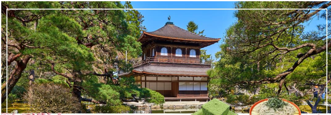
GINKAKUJI TEMPLE วัดกินคะคุจิ หรือ วัดเงิน

วันที่สอง ทำอากาศยานนานาชาติคันไซ โอซาก้า - เมืองเกียวโต - วัดกินคะคุจิ หรือ วัดเงิน - เมืองนาโกย่า - แจ๊ซ ดริม เอ้าท์เล็ท