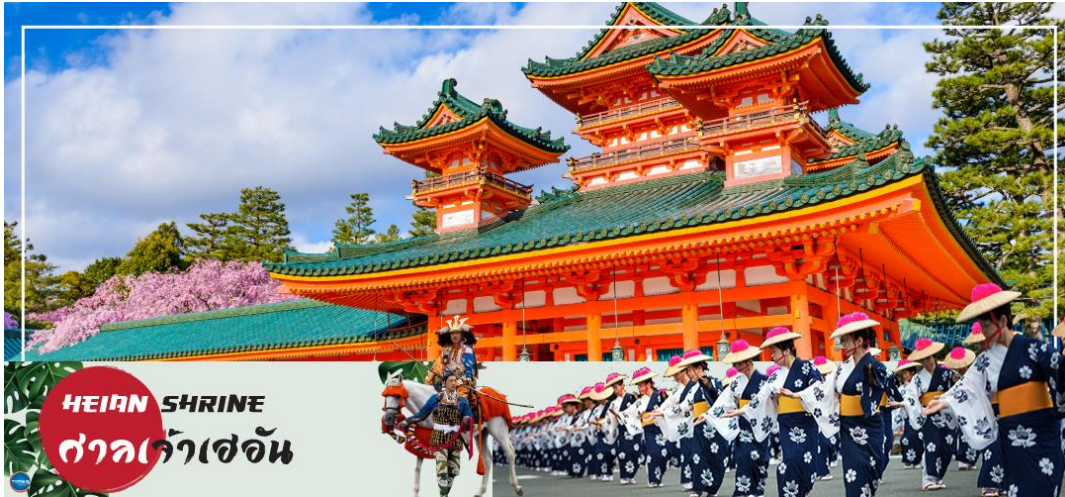
HEIAN SHRINE ศาลเจ้าเฮอัน

วันที่ห้า เมืองนาโกย่า – เมืองเกียวโต – ศาลเจ้าเฮอัน – การเรียนพิธีชงชาญี่ปุ่น – เมืองโอซาก้า – ศาลเจ้านัมมะยาซากะ – ช้อปปิ้งชินไซบาชิ