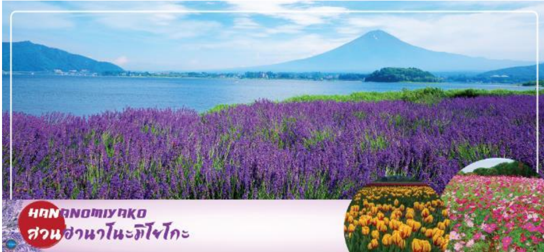
HANANOMIYAKO สวนฮานานะโนะมิยาโกะ

วันที่สอง ทำอากาศยานนานาชาตินาริตะ - เมืองยามานาชิ - สวนดอกไม้ฮานานะโนะมิยาโกะ หรือ เทศกาลชมดอกลาเวนเดอร์ที่ทะเลสาบคาวากุจิ (ตามฤดูกาล) หรือ Rainbow Flower Festival 2025 - หมู่บ้านโอชิโนะสึไก - ออนเซ็น + ชาบูยักษ์