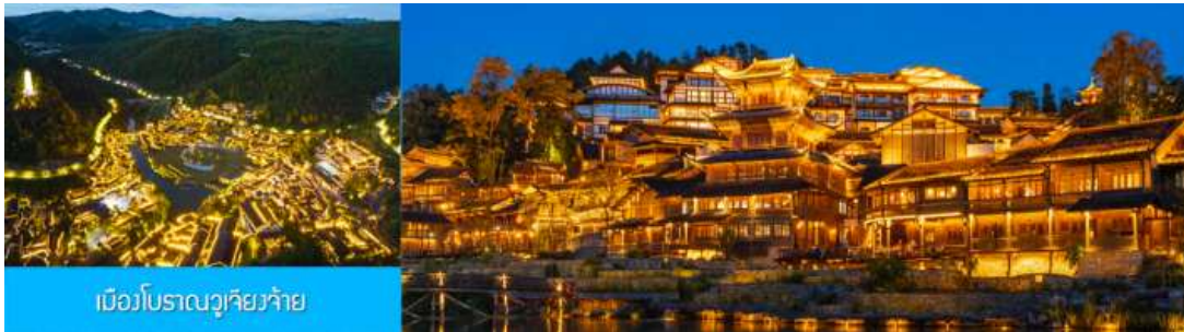
เมืองโบราณฉิวเฉียวจ้าย

รับประทานอาหารกลางวัน ณ ภัตตาคาร (มื้อที่ 5)