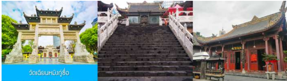
วัดเจียงหมิงกุ๋ซือ