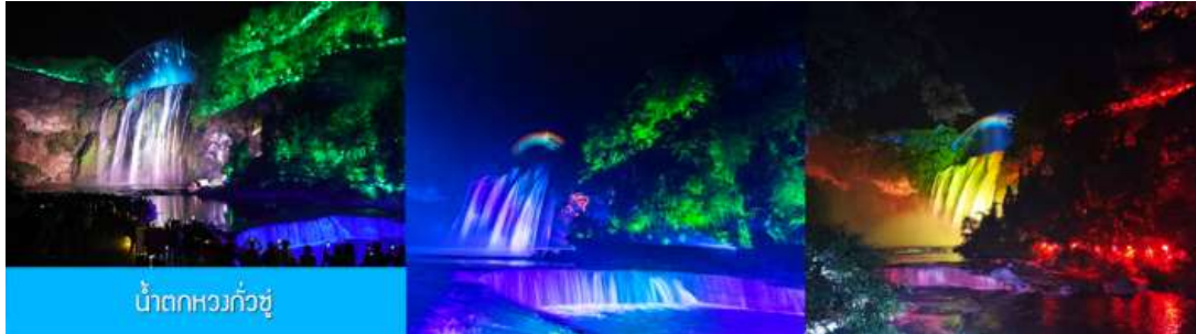
น้ำตกหวงกั๋วชู่

** ชำระค่าทัวร์ในนามบริษัท ไลออน ทราเวล จำกัด เท่านั้น **