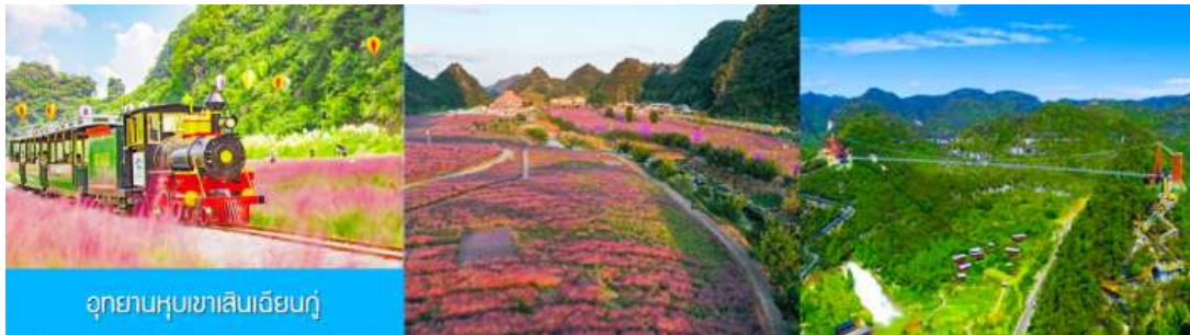
อุทยานหุบเขาเสียนเจียงกุ๋