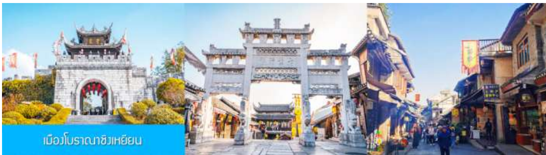
เมืองโบราณชิงเหยียน

รับประทานอาหารกลางวัน ณ ภัตตาคาร (มื้อที่ 8)