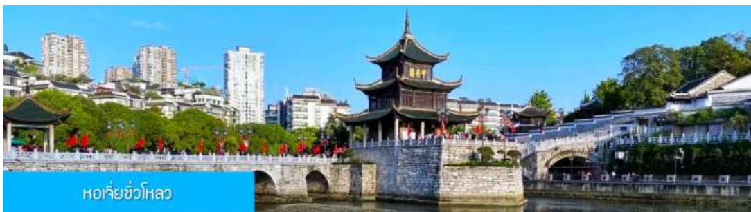
หอเจี้ยวฮั่วโหลว