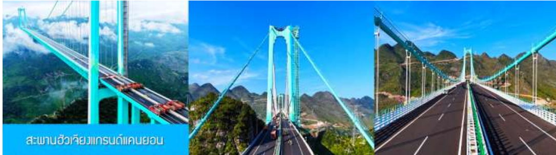
สะพานฉิวเฉียวเทรนดัดแค่นยอน

** ชำระค่าทัวร์ในนามบริษัท ไลออน ทราเวล จำกัด เท่านั้น **