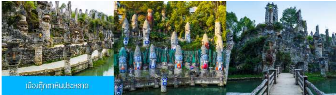
เมืองตึกหินประหลาด

พักที่ MUSHAN / XUN QIAN JI HOTEL โรงแรมระดับ 4 ดาวห้องดีน หรือเทียบเท่าในอุทยาน