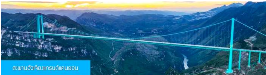
สะพานฮัวเจียงแกรนด์แคนยอน

พักที่ WINDHAM HOTEL โรงแรมระดับ 4 ดาวท้องถิ่นในเมืองอันชุ่น