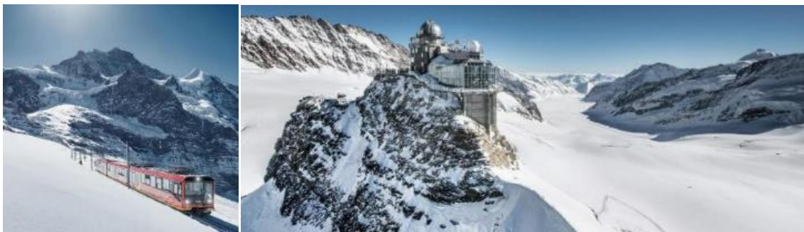
GO3VIE-EK019 A-D-CH มงคลเปิดประตูสู่จุงเฟราหนอย 7D4N-EK update 21 May 2026

จากนั้นนำท่านเดินทางข้ามพรมแดนระหว่างประเทศเยอรมนีกับสวิตเซอร์แลนด์เข้าสู่หมู่บ้านกรินเดลวาลด์ (Grindelwald) เมืองตากอากาศที่สวยงาม เพื่อขึ้นกระเช้าEiger Express กระเช้าลอยฟ้าตัวใหม่ สู่สถานี Eigergletscher โดยกระเช้าตัวนี้นอกจากจะ让您ได้เห็นวิวความสวยงามของจุงเฟราโดยรอบแล้วยังจะช่วยให้คุณลดเวลาลงกว่า 40 นาที เมื่อเทียบกับการขึ้นสู่ยอดเขาแบบเดิม หลังจากนั้นนำท่านเดินทางต่อด้วยรถไฟเพื่อขึ้นสู่สถานีรถไฟจุงเฟรายอร์ค (Jungfrauoch) สถานีรถไฟที่อยู่สูงที่สุดในยุโรป (Top of Europe) ระหว่างเส้นทางขึ้นสู่ยอดเขาท่านจะได้ผ่านชมธารน้ำแข็งที่มีขนาดใหญ่ โดยเมื่อปี ค.ศ.2001 องค์การยูเนสโกประกาศให้ยอดเขาจุงเฟรา เป็นพื้นที่มรดกโลกทางธรรมชาติแห่งแรกของยุโรป มีความสูงกว่าระดับน้ำทะเลถึง 11,333 ฟุตหรือ 3,454 เมตร