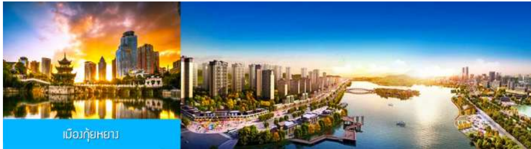
เมืองก๊วยหยาง