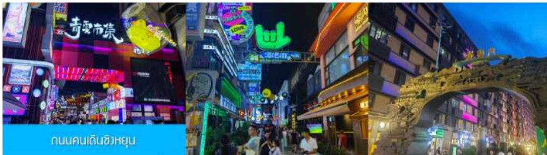
ถนนคนเดินชิงหยุน