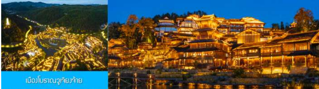
เมืองโบราณวูเจียงจ้าย

รับประทานอาหารกลางวัน ณ ภัตตาคาร (มื้อที่ 8)