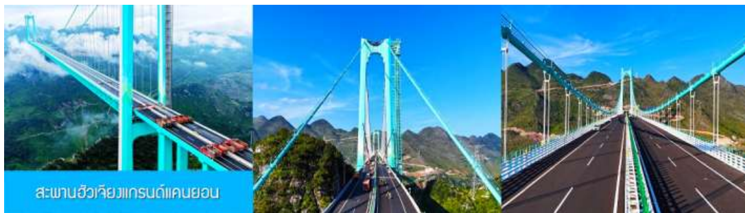
สะพานฮัวเจียงแกรนด์แคนยอน