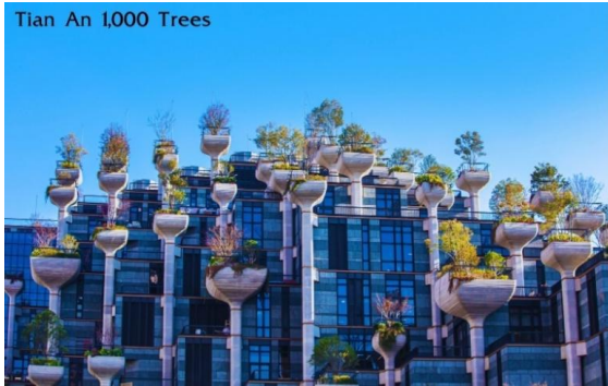
Tian An 1,000 Trees

นำท่านเดินทางสู่ เทียนอันเชียนชู่ (Tian An 1,000 Trees) หรือเรียกว่า อาคารพันต้นไม้ ชมความอลังการของอาคารพาณิชย์ที่ประดับตกแต่งด้วยต้นไม้มากกว่า 1,000 ต้น ได้รับการขนานนามว่าเป็นสิ่งมหัศจรรย์ของโลกสมัยใหม่ โดยคาดว่าต้นไม้ 1,000 ต้นเหล่านี้จะสามารถช่วยลดคาร์บอนไดออกไซด์ 21 ตันต่อปี ด้านในของอาคารมีทั้งส่วนของที่พักอาศัย ร้านอาหาร พิพิธภัณฑ์ แกลเลอรีศิลปะ อาหารสำนักงานและห้างสรรพสินค้า