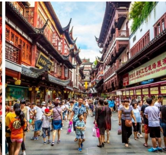
ตลาดเจียนหวังเมี่ยว หรือตลาดร้อยปี