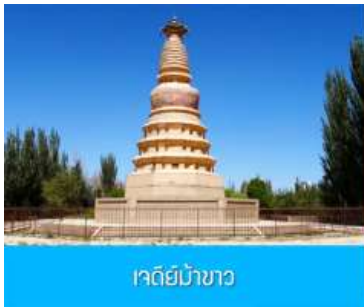
เจดีย์ม้าขาว

เที่ยง รับประทานอาหารกลางวัน ณ ภัตตาคาร (10)