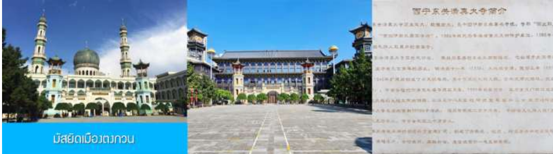
มัสยิดเมืองตงกวาน