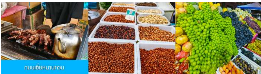
ถนนเซี่ยหนานกวน

หลังอาหารนำท่านเดินทางโดยรถบัสสู่ เมืองซีหนิง 西宁 (ระยะทาง 289 กม. ใช้เวลาเดินทางราว 3 ชั่วโมงเศษ)