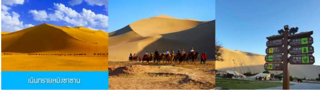
เป็นทรายหิมชางาน

** ชำระค่าทัวร์ในนามบริษัท ไลออน ทราเวล จำกัด เท่านั้น **