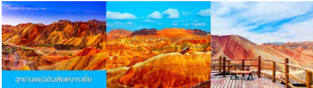
อุทยานธรณีดินสีแห่งจางเยี่ย