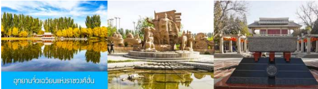
อุทยานจี้เวียนแห่งราชวงศ์ฮั่น

จากนั้นนำท่านเดินทางสู่เมืองจี้เวียน (ระยะทาง 50 กม. ใช้เวลาเดินทาง 1 ชั่วโมง)