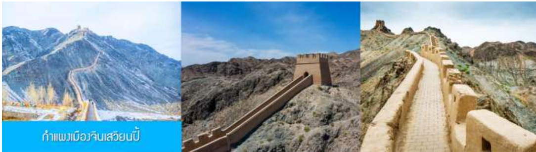
กำแพงเมืองจีนเสวียนเป่