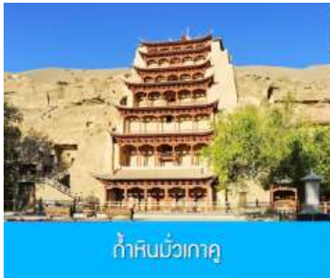
ถ้ำหินมั่วเกาถู

เช้า รับประทานอาหารเช้า ณ ห้องอาหารของโรงแรม (9)