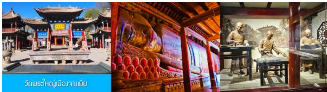
วัดพระใหญ่เมืองจางเยี่ย

เช้า รับประทานอาหารเช้า ณ ห้องอาหารของโรงแรม (15)