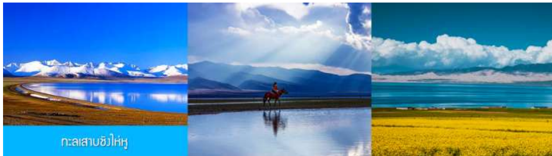
ทะเลสาบชิงไห่หู่

เช้า รับประทานอาหารเช้า ณ ห้องอาหารของโรงแรม (1) หลังอาหารเช้าท่านเดินทางโดยรถบัสสู่ ทะเลสาบชิงไห่หู่ (ระยะทาง 150 กม.ใช้เวลาเดินทางราว 2 ชั่วโมงเศษ)