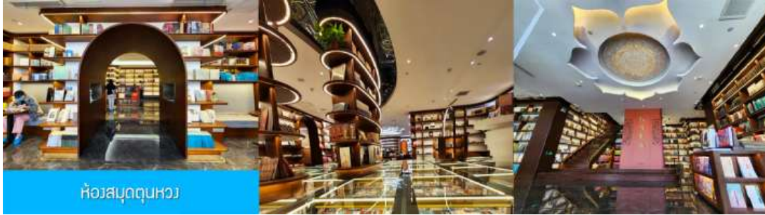
ห้องสมุดตุนหวง

** ชำระค่าทัวร์ในนามบริษัท ไลออน ทราเวล จำกัด เท่านั้น **