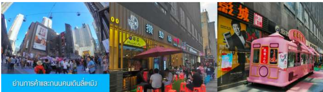
ย่านการค้าและถนนคนเดินลีเหมิง

หลังอาหารนำท่านสู่ ย่านการค้าและถนนคนเดินลีเหมิง 力盟商业步行街 ย่านการค้าทันสมัยที่มีห้างสรรพสินค้าขนาดใหญ่หลายแห่ง ถนนคนเดินที่คึกคักไปด้วยร้านค้าแบรนด์ท้องถิ่น ร้านอาหารพื้นเมือง ร้านสะดวกทานฟาสต์ฟู้ด ให้เวลาอิสระท่านเดินช้อปปิ้ง ชิมอาหารพื้นเมืองเต็มที่