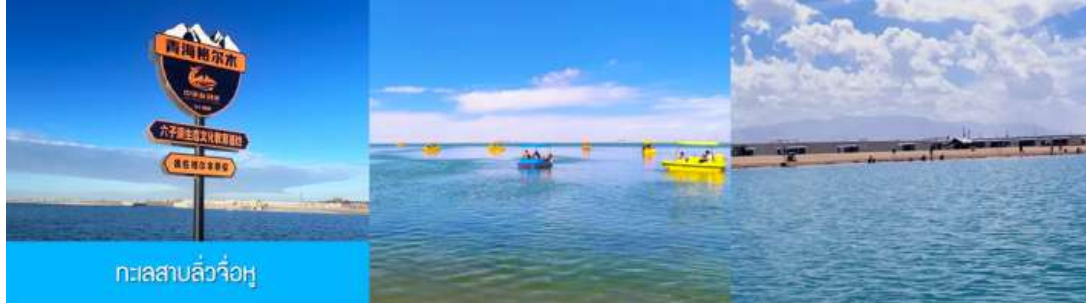
ทะเลสาบลู่วี่อู

** ชำระค่าทัวร์ในนามบริษัท ไลออน ทราเวล จำกัด เท่านั้น **