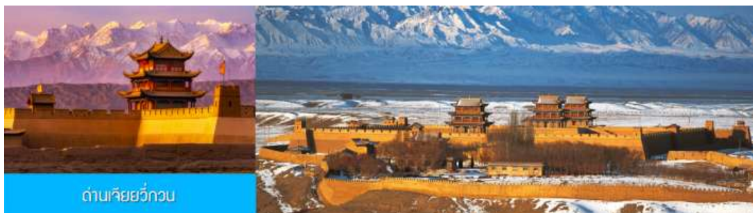
ด่านเจียชี่กวน

รับประทานอาหารเช้า ณ ห้องอาหารของโรงแรม (12)