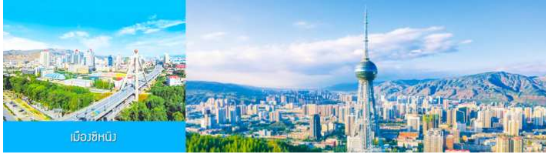
เมืองซีหนิง

** ชำระค่าทัวร์ในนามบริษัท ไลออน ทราเวล จำกัด เท่านั้น **