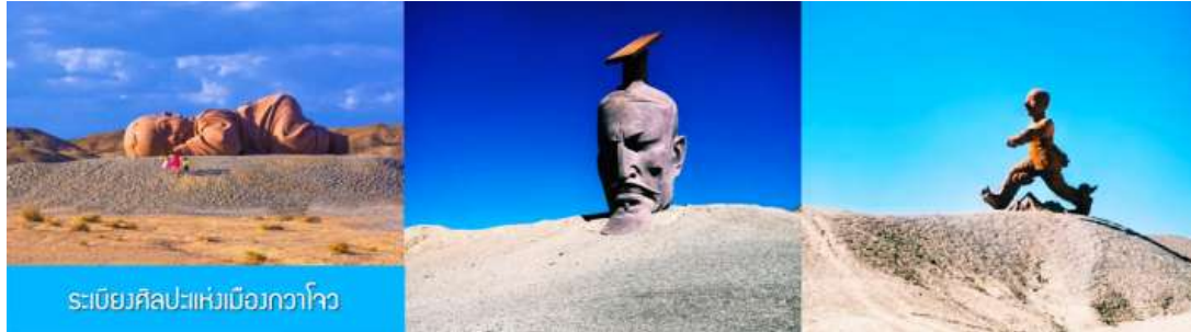
ระเบียงศิลปะแห่งเมืองกวาโจว

** ชำระค่าทัวร์ในนามบริษัท ไลออน ทราเวล จำกัด เท่านั้น **