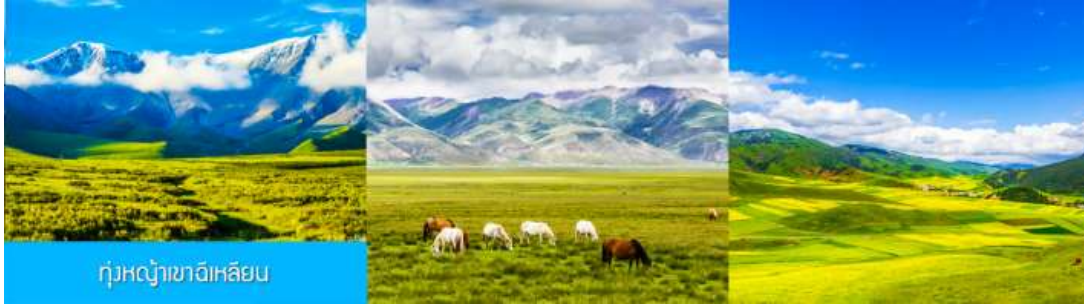
ทุ่งหญ้าเขาลีเทียน

จากนั้นนำท่านเดินทางโดยรถบัสสู่ทุ่งหญ้าสีเขียว (ระยะทาง 140 กม. ใช้เวลาเดินทางประมาณ 2 ชั่วโมง)