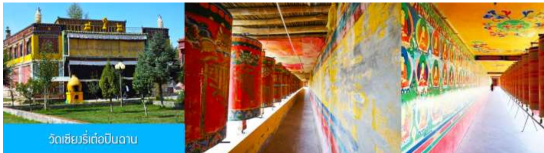
วัดเซียงรีเต๋อปีนฉาน