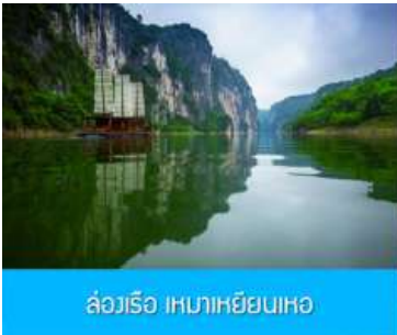
ส่องเรือ เหมาเหยียนเหอ