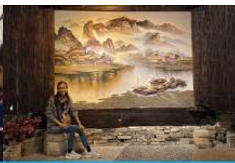
พิพิธภัณฑภาพเขียนหินทราย