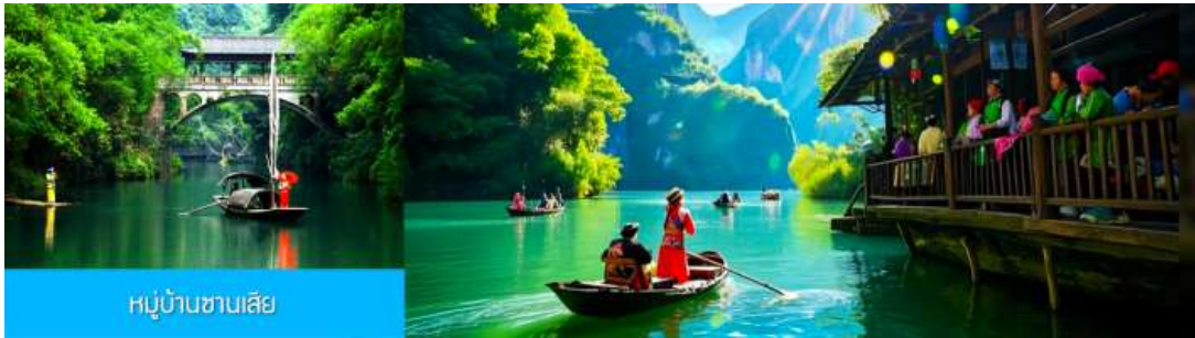
หมู่บ้านชานเสี๋ย

พักที่ YICHANG HUIHAO HOTEL โรงแรมระดับ 4 ดาวหรือเทียบเท่าในเมืองหยี่ชาง