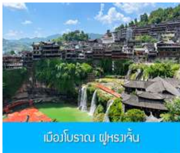
เมืองโบราณ ฝูหรงเจิน

จากนั้นนำท่านเดินทางสู่เมืองฝูหรงเจิน นำท่านเที่ยวชม เมืองโบราณ ฝูหรงเจิน 芙蓉古镇 เมืองโบราณเก่าแก่ขึ้นชื่อของมณฑลหูหนานที่โด่งดังจาก ภาพยนตร์เรื่อง ฝูหรงเจิน เป็นสถานที่ท่องเที่ยวระดับ 4A ที่ได้รับความนิยมจากนักท่องเที่ยวทั่วโลกกับเมืองโบราณฟิงหวง เป็นสถานที่หลักในการถ่ายทำภาพยนตร์เรื่อง ฝูหรงเจิน ทำให้สถานที่แห่งนี้อย่างได้รับความนิยมจากนักท่องเที่ยว จุดไฮไลท์ของเมืองโบราณแห่งนี้ นอกจากบ้านเรือนโบราณสวยเก๋ที่เป็นเอกลักษณ์เฉพาะของมณฑลหูหนาน ที่ยังมีน้ำตกขนาดใหญ่ที่สวยงามกลางเมืองที่เป็นจุดเช็คอิน