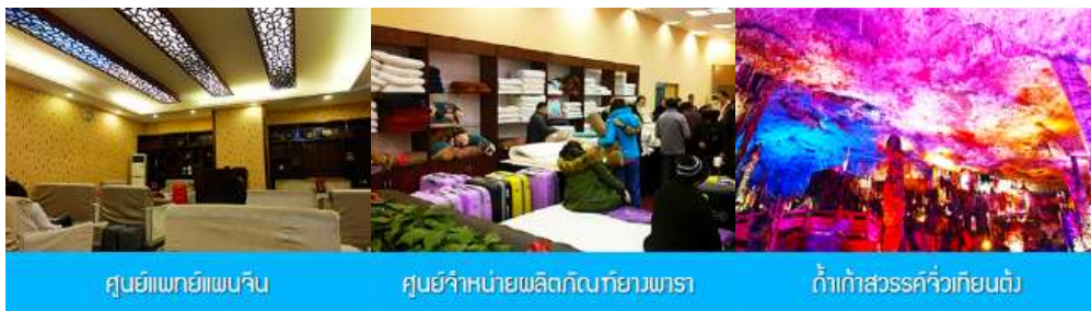
ศูนย์แพคเกจจีน

อัตราค่าบริการสำหรับโปรแกรมเสริมการแสดงชุด The love Story of Wooden man and Fairy Fox ท่านละ 400 หยวน (หรือประมาณ 2000.-บาทขึ้นอยู่กับอัตราแลกเปลี่ยน) ระยะเวลาที่ใช้ในการเที่ยวชมการแสดง ประมาณ 3 ชั่วโมง รวมเวลาเดินทางไปกับค่าบริการรวม ค่าบัตรเข้าชม ค่ารถรับ ส่ง และค่าน้ำทิพย์ของไกด์ท้องถิ่น