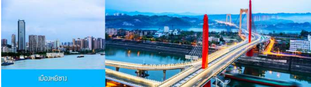
เมืองหยี่ชาง