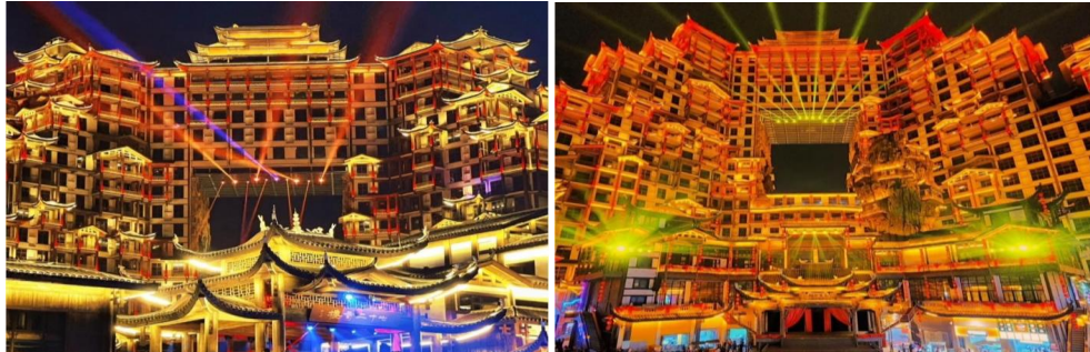
🏨 พักที่ WYNDHAM ZHANGJIAJIE RUIJING MANSHAN HOTEL หรือเทียบเท่าระดับ 5 ⋄⋄⋄⋄⋄

** ชำระค่าทัวร์ในนามบริษัท ไลออน ทราเวล จำกัด เท่านั้น **