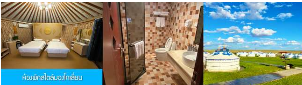
ห้องพักสไตล์มองโกลเลียน