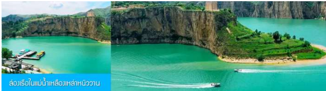
ล่องเรือในแม่น้ำเหลืองเหล่าหนิววาน

รับประทานอาหารกลางวัน ณ ร้านอาหารระหว่างทาง (8)