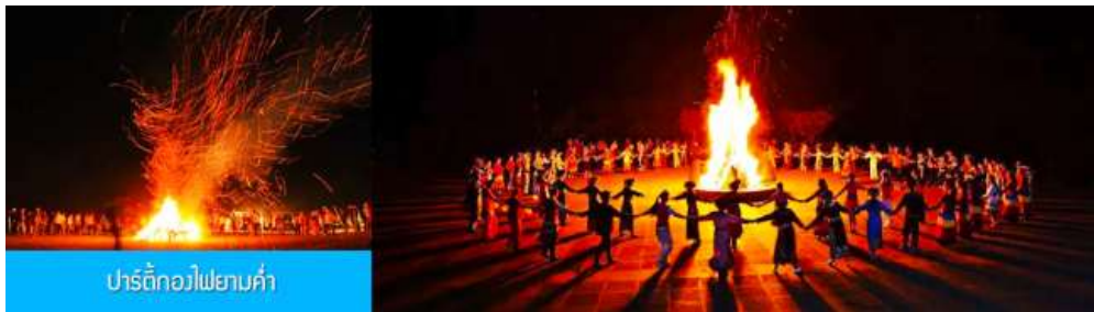
ปาร์ตี้ก๊อไฟยามค่ำ

Mongolian Gala Dinner งานเลี้ยงอาหารค่ำสไตล์มองโกลที่มีมาแต่อดีต จัดขึ้นในโอกาสเฉลิมฉลองสำคัญ หรือเลี้ยงต้อนรับแขกวีไอพี ผู้ร่วมงานเลี้ยงแต่งชุดพื้นเมืองเต็มรูปแบบเข้าร่วมงานเลี้ยง มีการแสดงพื้นเมืองให้ผู้ร่วมงานได้รับชมระหว่างงานเลี้ยง เมนูหลักเป็นอาหารมองโกลที่มีเนื้อวัว เนื้อแกะ โยเกิร์ต ผักและผลไม้เป็นหลัก.....อัตราค่าบริการสำหรับ Mongolian Gala dinner 380 หยวน หรือ 1,900 บาท/ท่าน (สำหรับลูกค้าทัวร์ที่ไม่ซื้อโปรแกรมเสริม ทางทัวร์ยังคงจัดอาหารค่ำให้ตามปกติ) รับประทานอาหารค่ำ ณ ภัตตาคาร (3)