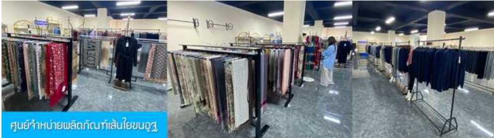
ศูนย์จำหน่ายผลิตภัณฑ์เส้นใยขนอูฐ

วันที่สาม ศูนย์จำหน่ายผลิตภัณฑ์เส้นใยขนอูฐ - เนินทรายเสียงซาวาน - ชีอูฐกลางทะเลทราย-โกด์เสนอขาย โปรแกรมเสริม แพคเกจเที่ยวเกาะเจียนซา