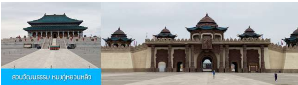
สวนวัฒนธรรมหรงกู่หยวนหลิว

นำท่านชม น้ำพุดนตรีกังปาลีอ 康巴什音乐喷泉 ณ บริเวณจัตุรัสกังปาลีอริมแม่น้ำวุลันมู่หลุน ต้องบอกว่า เป็นน้ำพุดนตรี ที่ผสมผสานของน้ำพุ เสียงดนตรี แสงสี ใต้อย่างลงตัวและสวยงาม ประกอบด้วยหัวฉีด 2970 หัว สปอร์ตไลท์ใต้น้ำ 1687 ดวง และเครื่องปั้มน้ำ 199 เครื่อง น้ำพุที่สูงสุดมีความสูงกว่า 200 เมตร เมื่อเสร็จจากการชมน้ำพุดนตรี นำท่านเดินทางเข้าโรงแรมที่พัก พักที่ ORDOS BOYU AIRUI HOTEL โรงแรมระดับ 4 ดาวท้องถิ่น หรือเทียบเท่าในเมืองออร์ดอส