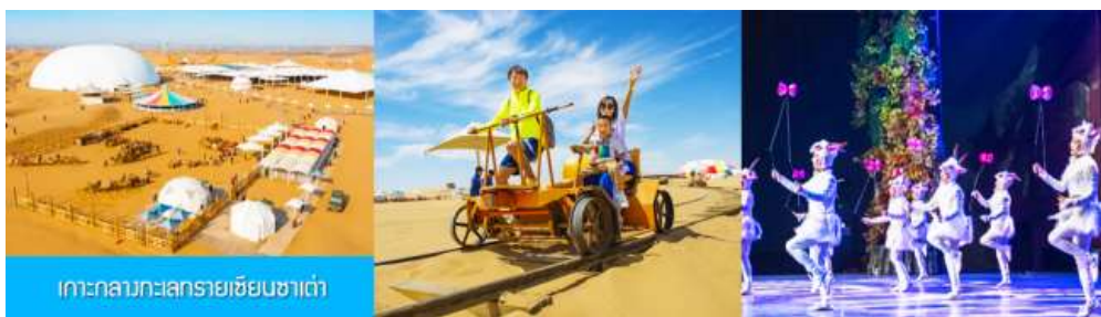
เกาะกลางทะเลทรายเชียนซาเต๋า