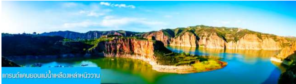
แกรนด์แคนยอนแม่น้ำเหลืองเหล่าหนิววาน

พักที่ DALATEQI SHNAGJING HOTEL โรงแรมระดับ 4 ดาวหรือเทียบเท่าในเมืองต้าลาเทอ