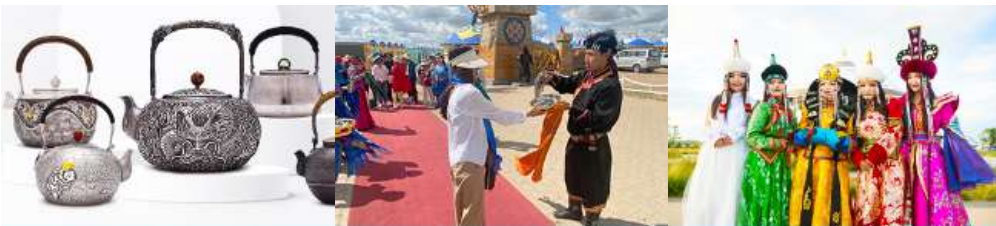
พิพิธภัณฑ์เครื่องปั้นดินเผา