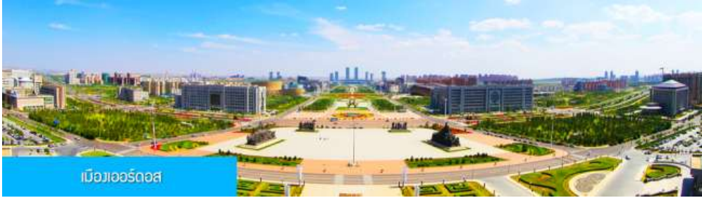
เมืองเออร์ดอส