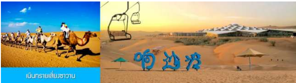
เนินทรายเสียงซาวาน

เที่ยง รับประทานอาหารกลางวัน ณ ภัตตาคาร (5)