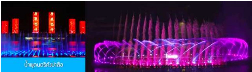
น้ำพุดนตรีกังปาลีอ

นำท่านชม น้ำพุดนตรีกังปาลีอ 康巴什音乐喷泉 ณ บริเวณจัตุรัสกังปาลีอริมแม่น้ำวุลันมู่หลุน ต้องบอกว่า เป็นน้ำพุดนตรี ที่ผสมผสานของน้ำพุ เสียงดนตรี แสงสี ใต้อย่างลงตัวและสวยงาม ประกอบด้วยหัวฉีด 2970 หัว สปอร์ตไลท์ใต้น้ำ 1687 ดวง และเครื่องปั้มน้ำ 199 เครื่อง น้ำพุที่สูงสุดมีความสูงกว่า 200 เมตร เมื่อเสร็จจากการชมน้ำพุดนตรี นำท่านเดินทางเข้าโรงแรมที่พัก พักที่ ORDOS BOYU AIRUI HOTEL โรงแรมระดับ 4 ดาวท้องถิ่น หรือเทียบเท่าในเมืองออร์ดอส