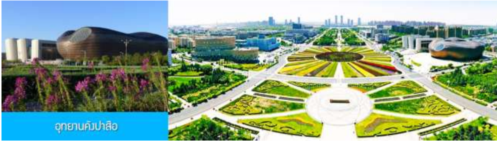
อุทยานคัมปาเลือ