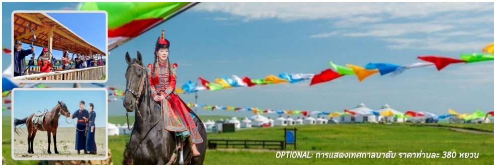
OPTIONAL: การแสดงเทศกาลนาดัม ราคาทำนละ 380 หยวน

เทศกาลนาดัม (Naadam Festival) หรือที่ชาวมองโกลเรียกว่า "อีรีน กูร์วัน นาดัม" (Eriin Gurvan Naadam) ซึ่งแปลว่า "สามเกมแห่งบุรุษ" มีรากฐานย้อนกลับไปถึงยุคของเจงกิสข่านเป็นการเฉลิมฉลองวัฒนธรรม ประเพณี รวมไปถึงการแสดงศิลปะพื้นบ้าน 1. พิธีแต่งงานแบบชาวเออร์ติวชื่อ 2. ละครแสดงกลางแจ้ง 3. งานเลี้ยงรอบกองไฟ 4. ทွ่งหญ้าเห็นเวหา 5. ถ่ายรูปบนหลังม้า 6. เล่นหญ้าไถล 7. รถไฟราง 8. Graffiti 9. สวนสนุกเด็ก 10. กอล์ฟทุ่งหญ้า 11. รถบีเอ็ม 12. คาร์ท/คาร์ทเด็ก 13. ขว้างลูกบอลบนหญ้า 14. ปืนใหญ่มองโกล 15. ยิงธนูในร่ม 16. การแข่งขันจับแกะ 17. จำลองการจับม้า 18. หมูหมุน/เครื่องกระโดดหมุน 19. ให้อาหารลูกแกะ 20. ยิงธนู 21. ขว้างหลอด 2. สามารถเข้าร่วมได้สูงสุด 12 กิจกรรม หมายเหตุ : บางกิจกรรมอาจมีการเปลี่ยนแปลงโดยไม่ได้แจ้งให้ทราบล่วงหน้า ทั้งนี้ขึ้นอยู่กับสภาพภูมิอากาศในแต่ละปี รมกานสอบถามกับทางไกด์ท้องถิ่น หรือหัวหน้าทัวร์ให้ละเอียดก่อนการตัดสินใจซื้อ