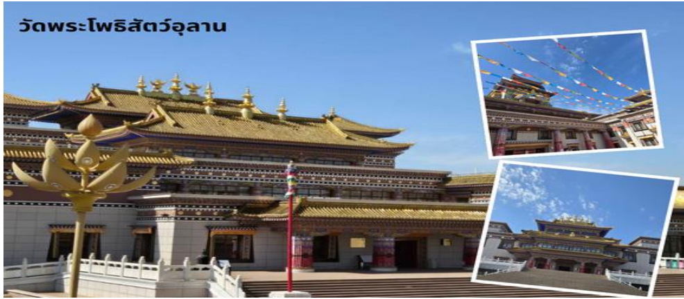
วัดพระโพธิสัตว์อุลาน

เช้า บริการอาหาร ณ ห้องอาหารของโรงแรม นำท่านสู่ ร้านสินค้าพื้นเมืองร้านเครื่องเงิน นำท่านสู่ วัดพระโพธิสัตว์อุลาน เป็นสถานที่ท่องเที่ยวระดับ 4A ครอบคลุมพื้นที่ประมาณ 20,000 ตารางเมตร รูปแบบอาคารเป็นสถาปัตยกรรมแบบผสมผสานมองโกล ทิเบต และฮั่น ภายในมีการจัดแสดงโบราณวัตถุทางวัฒนธรรมที่ยังคงมีความสมบูรณ์