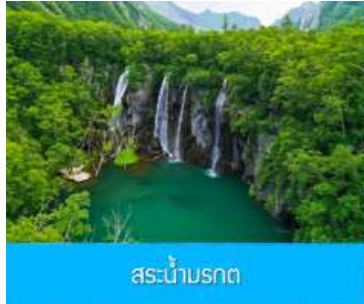
สะพานบรกด