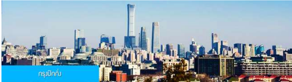
กรุงปักกิ่ง

** ชำระค่าทัวร์ในนามบริษัท ไลออน ทราเวล จำกัด เท่านั้น **