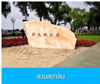
สวนสาธารณะ