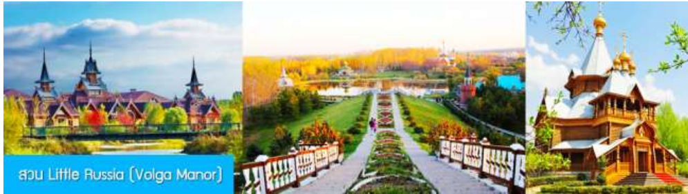
สวน Little Russia (Volga Manor)

จากนั้นนำท่านเที่ยวชม สวน LITTLE RUSSIA (VOLGA MANOR) 伏尔加庄园 สวนพฤกษศาสตร์ที่ออกแบบคล้ายพระราชวังสไตล์รัสเซียในยุคกลางบนเนื้อที่กว่า 600,000 ตารางเมตร แหล่งท่องเที่ยวระดับ 4A และเป็นศูนย์แลกเปลี่ยนทางวัฒนธรรมระหว่างรัสเซีย และจีน อาคารทุกหลังภายในสวนแห่งนี้ล้วนถูกออกแบบอย่างปราณีต โดยสถาปนิกชาวรัสเซีย ประกอบด้วย อาคารและอุทยานหรือสไตล์รัสเซียที่โดดเด่นด้วยเอกลักษณ์ อาทิ วิหาร โรงแรม ภัตตาคาร พิพิธภัณฑ์ศิลปะ โบสถ์คริสต์ออร์ทอดอกซ์ โรงเหล้าวอดก้า ฯลฯ ที่แวดล้อมด้วยป่าไม้ สวนหย่อม ลำธาร สะพานไม้ เป็นแหล่งท่องเที่ยวสไตล์รัสเซียที่มีมุมเก็บภาพและจุดเช็คอินเก๋ไก๋มากที่สุดในเมืองฮาร์บิน.....ให้ท่านเดินเล่น และเก็บภาพตามมุมสวยในสวนได้ตามอัธยาศัย