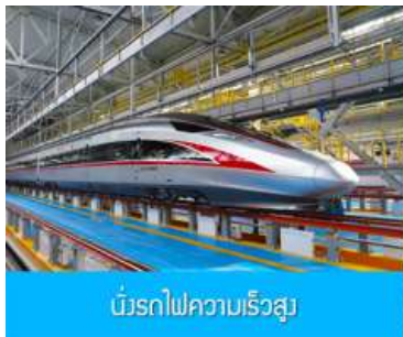
บริการรถไฟความเร็วสูง

หลังอาหารนำท่านเดินทางสู่สถานีรถไฟความเร็วสูงเมืองฮาร์บิน เตรียมขึ้นรถไฟความเร็วสูงสู่กรุงปักกิ่ง