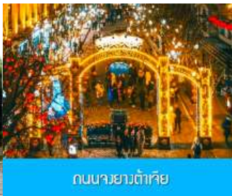
ถนนสายหลัก