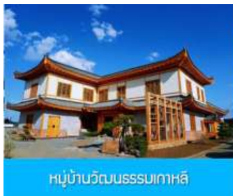
หมู่บ้านวัฒนธรรมเกาหลี

จากนั้นนำท่านเดินทางสู่เมืองตุนฮว่า 敦化 (ระยะทาง 130 กม. ใช้เวลาเดินทางราว 2 ชั่วโมง)