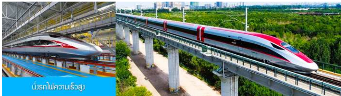
บึ๋นรถไฟความเร็วสูง