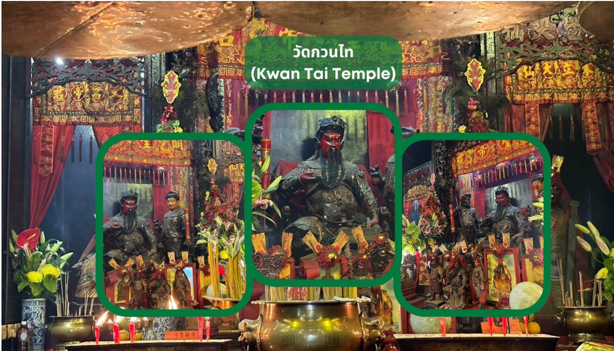
วัดกวนไท (Kwan Tai Temple)

จากนั้นนำท่านเดินทางสู่ วัดกวนไท (Kwan Tai Temple) สร้างขึ้นในปี 1891 เพื่อบูชาเทพเจ้ากวนอู ซึ่งเป็นเทพเจ้าแห่งความซื่อสัตย์ และเปี่ยมไปด้วยคุณธรรม ภายในวัดมีรูปปั้นกวนอูขนาดใหญ่ตั้งอยู่ที่แท่นบูชา มีผู้คนจำนวนมากมาสักการะท่านกวนอูเพื่อขอพรให้ประสบความสำเร็จในธุรกิจ เรื่องความโชคดี โชคลาภ การค้าขาย และการปกป้องคุ้มครอง