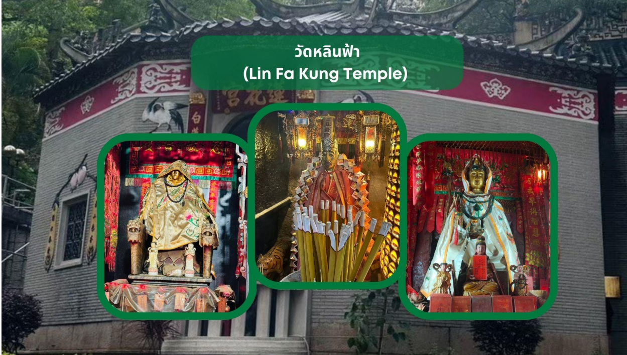
วัดหลินฟา (Lin Fa Kung Temple)

** ชำระค่าทัวร์ในนามบริษัท ไลออน ทราเวล จำกัด เท่านั้น **