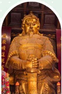
วัดเซกวง

"ไหว้พระ เสริมดวง เพิ่มสิริมงคลแก่ชีวิต"