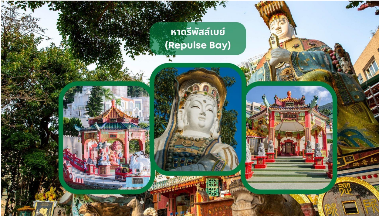
หาดรีพัลส์เบย์ (Repulse Bay)

** ชำระค่าทัวร์ในนามบริษัท ไลออน ทราเวล จำกัด เท่านั้น **