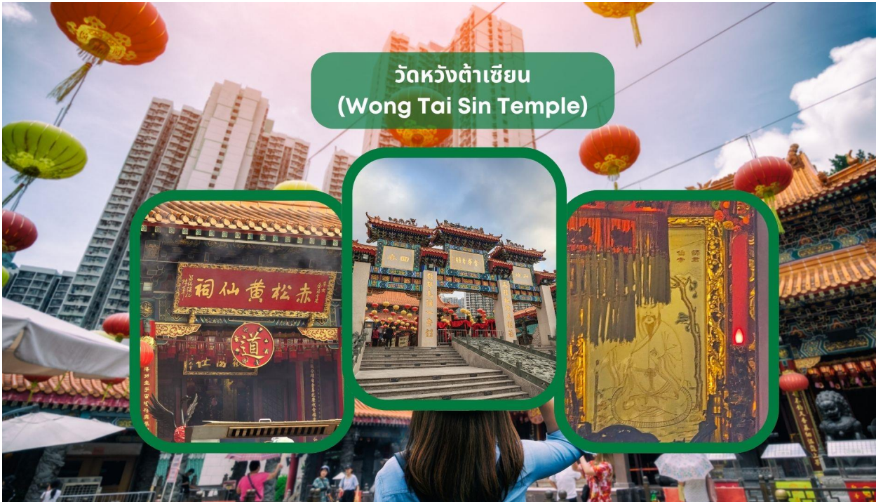
วัดหวังต้าเซียน (Wong Tai Sin Temple)

รับประทานอาหารเช้า ณ ภัตตาคาร บริการท่านด้วยเมนูต้มชาฮ่องกง (มื้อที่ 2)