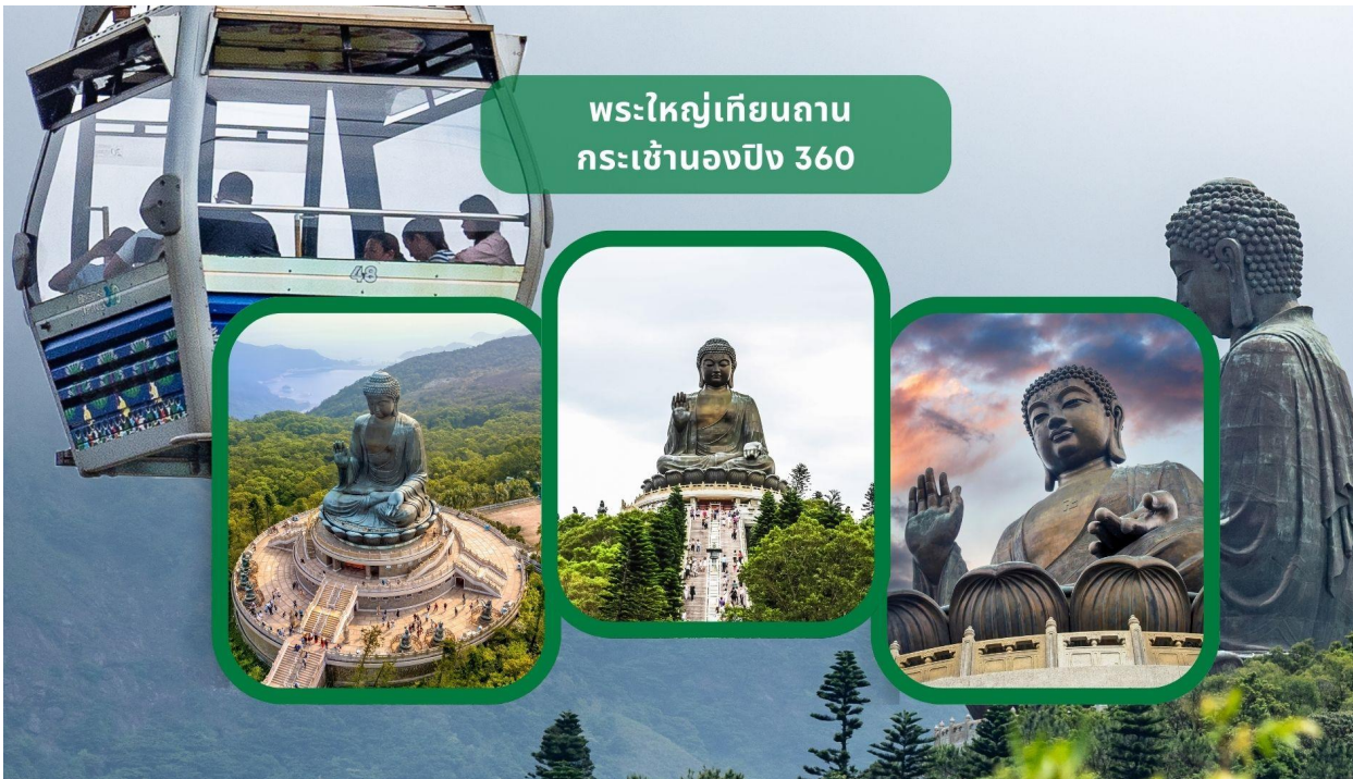
พระใหญ่เทียนถาน กระเช้าองปิง 360

** ชำระค่าทัวร์ในนามบริษัท ไลออน ทราเวล จำกัด เท่านั้น **