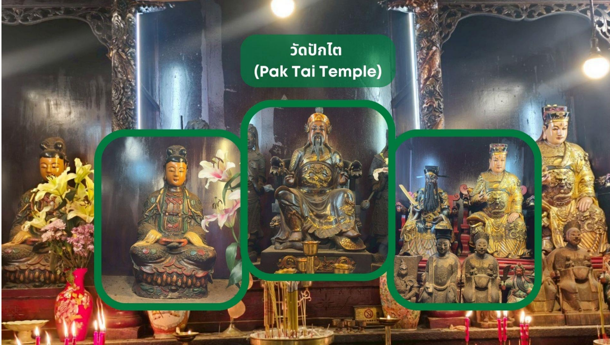
วัดปักโต (Pak Tai Temple)

นำท่านเดินทางสู่ วัดปักโต (Pak Tai Temple, Hong hum) เป็นหนึ่งในวัดที่เก่าแก่และสำคัญที่สุดในฮ่องกง โดยสร้างขึ้นเพื่อบูชา เทพเจ้าปักโต ซึ่งเป็นเทพเจ้าประจำทิศเหนือ เทพแห่งชัยชนะ ตามความเชื่อในลัทธิเต๋า เทพองค์นี้มีพลังอำนาจในการปกป้องผู้คนจากสิ่งชั่วร้าย และให้พรด้านความมั่งคั่ง ความแข็งแกร่ง และอายุยืน ปัจจุบันผู้คนนิยมไปขอพรเพื่อเสริมโชค เสริมอำนาจ ขจัดอุปสรรคและปกป้องจากสิ่งชั่วร้าย