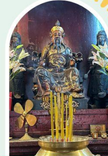
วัดปักไต้ฮ่องกง