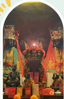
วัดหมั่นโหมว