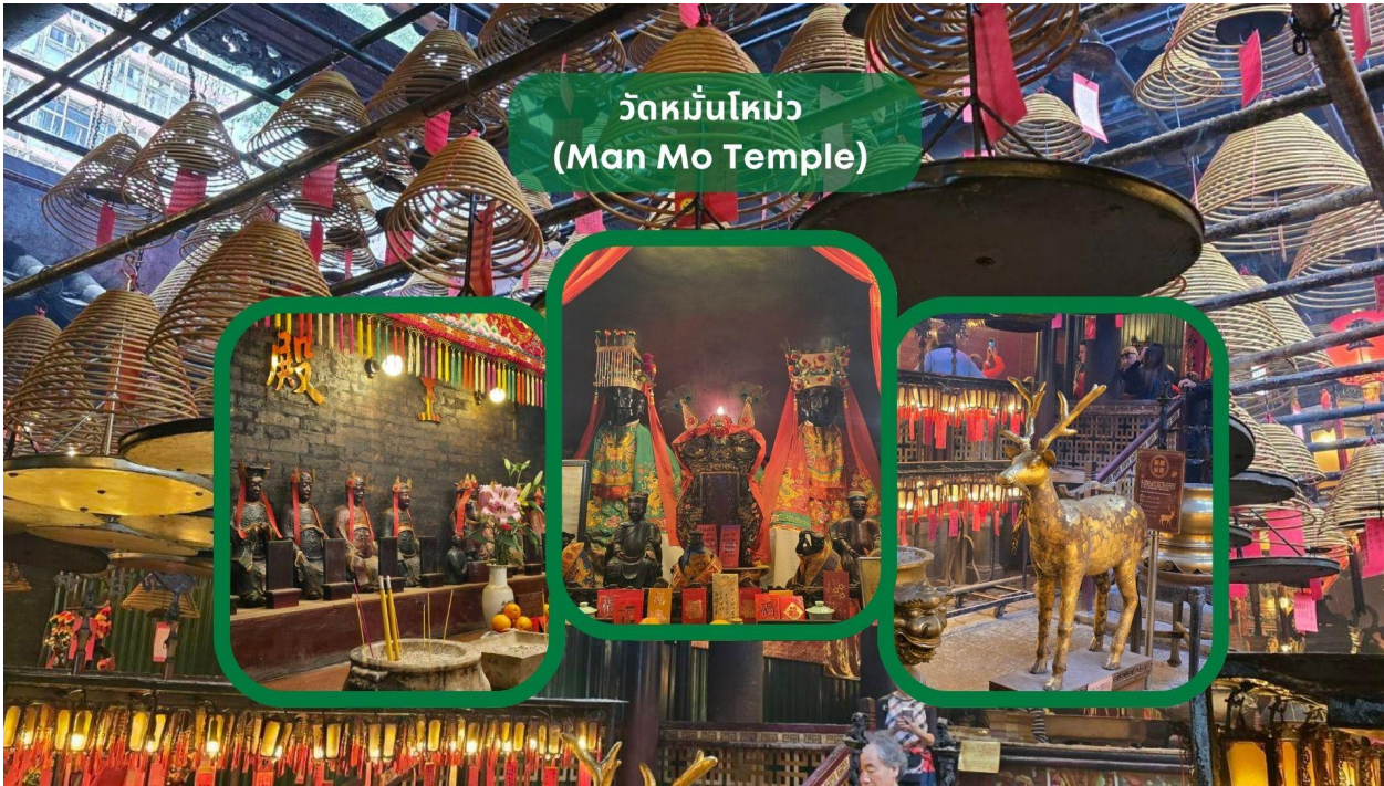
วัดหมั่นโหม่ว (Man Mo Temple)

นำท่านเดินทางสู่ วัดหมั่นโหม่ว (Man Mo Temple) วัดเก่าแก่และใหญ่ที่สุดในบรรดาวัดหมั่นโหม่วทั้งหมดของฮ่องกง ตั้งอยู่ในย่าน Sheung Wan ขึ้นชื่อในเรื่องการขอพรด้านการเรียน ภายในวิหารโดดเด่นด้วยชุดรูปแขวนติดกับฉากหลังสีแดง-ทองอันสง่างาม สร้างขึ้นเพื่อสักการะ เทพเจ้าหมั่นไต่กวัน (Man) เทพแห่งการเรียนรู้ (ด้านบุน) และ เทพเจ้าโหม่วไต่กวัน (Mo) หรือ เทพกวนอู เทพแห่งสงคราม (ด้านบู๊) บรรยากาศภายในวัดงดงามและแฝงด้วยความศักดิ์สิทธิ์เหนือธรรมชาติ