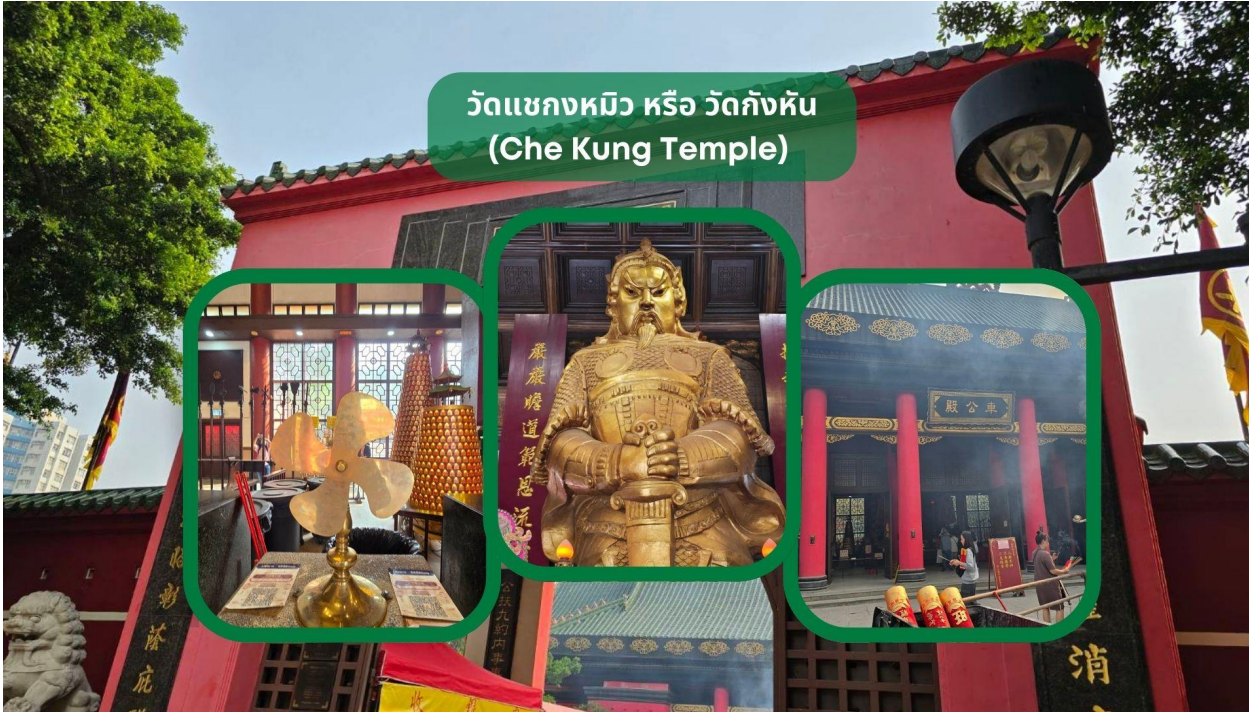
วัดแขกหมิว หรือ วัดกังหัน (Che Kung Temple)

จากนั้นนำท่านเดินทางสู่ วัดแขกหมิว หรือ วัดกังหัน (Che Kung Temple) ขอพรเรื่องการเดินทางปลอดภัย สุขภาพแข็งแรง โชคลาภ และเงินทอง วัดตั้งฮ่องกงที่ตั้งมาถึงเมืองไทย เป็นวัดที่มีประวัติศาสตร์ยาวนานกว่า 300 ปี ภายในวัดมีรูปปั้นสีทองเหลืองอร่าม ตั้งตระหง่านทั้งชายและขวา เป็นวัดศักดิ์สิทธิ์ที่มีความเชื่อในเรื่องกังหันลม โดยความหมายของใบพัดทั้ง 4 คือ เดินทางปลอดภัย อายุยืนยาว เงินทองไหลมาเทมา และสมปรารถนาทุกประการ หากหมุนกังหันตามเข็มนาฬิกา 3 รอบ จะพัดพาเอาสิ่งไม่ดีออกชีวิต และนำสิ่งดีๆ เข้ามาแทน