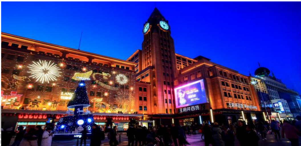
BW ปักกิ่ง เมืองโบราณกุ่เป่ย์สุ่ยเจิ้น 5D4N(Premium) by TG on Aug-Dec26-New Year26 อัปเดต 14-5-26

นำท่านเดินทางสู่ ถนนหวังฝูจิ่ง ถนนกลางคืนที่มีชื่อเสียงของปักกิ่ง นำท่านสัมผัสชีวิตและแสงสียามค่ำคืนของนครปักกิ่ง ตลาดถนนคนเดินทางแห่งกรุงปักกิ่งที่รวบรวมสินค้าอันหลากหลายไม่ว่าจะเป็นข้าวของเครื่องใช้ เสื้อผ้า และอาหารที่ขึ้นชื่อยอดนิยมของชาวจีน ไปจนถึงอาหารแปลกตาที่หารับประทานยาก ถือได้ว่าเป็นหนึ่งในเอกลักษณ์ และสีสันอันคึกคักของถนนหวังฝูจิ่ง โดยสถานที่ไฮไลท์ที่ห้ามพลาด ถนนอาหารแปลก เป็นตรอกเล็กๆ ที่เปิดเฉพาะช่วงกลางคืน มีสารพัด อาหารแปลกๆ มากมาย อาทิ ตะขาบ แมงป่อง ปลาดาว ม้าน้ำ หอยเม่น ซึ่งคนจีนเชื่อว่าเป็นอาหารที่บำรุงร่างกาย นอกจากนี้ ยังมีร้านขาย "ขนมปังถังหลู" ขนมหวานโบราณยอดนิยมของชาวจีนนั่นเองลงบันไดเลื่อนภายในห้างหวังฝูจิ่ง