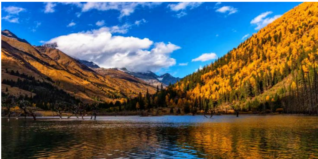
6. BIG PARADISE เงินดู-สีดรุณ-ต่ากุกลาเซียร์-จิวจ้ายโกว 6วัน5คืน (TG) on Aug - Dec 2026

บ่าย นำท่านเที่ยวชม หุบเขาซวงเฉียวโกว หรือหุบเขาสะพานคู่ มีระยะทาง 34.8 กม. มีพื้นที่รวม 216 ตารางกิโลเมตร เป็นจุดวิวทิวทัศน์ที่สวยงามที่สุด ชมความงามธรรมชาติของซวงเฉียวโกว(ลำน้ำสองสะพาน) ธารน้ำมีความยาว 35 กิโลเมตร มีทิวทัศน์ของภูเขาเป็นหลัก, ลำธารผ่านจุดต่างๆที่เป็นจุดทิวทัศน์ ไม่ว่าจะเป็น ซานกัวจวง,เขาหนิวซิน, เยเหรินเฟิง ถือเป็นจุดท่องเที่ยวแห่งหนึ่งของเขาสีดรุณที่รวบรวมจุดสำคัญหลายๆอย่างเข้าด้วยกันไว้ ชมไฮไลท์จุดชมวิว โดยมีจุดท่องเที่ยวแบ่งออกเป็น 3 ส่วนด้วยกันหุบเขาหยิหยาง ล้อมรอบไปด้วยภูเขาทุกทิศทุกทาง ซึ่งอยู่ในส่วนที่ลึกที่สุดและจะได้เห็นธารน้ำแข็ง ภูเขากระจกแก้ว ภูเขาดวงอาทิตย์ ภูเขาดวงจันทร์ ยอดเขากระต่าย - ทุ่งหญ้าเหนียนหยูป่า ชมยอดเขารูปร่างแปลกตา เช่น ยอดเขาพราน ยอดวังโปตาลา ยอดเขาเพชร - ภูเขาหญิงตั้งครรภ์ มีทิวทัศน์ที่สวยงามของท้องทุ่งกว้าง โดยมีฉากหลังเป็นภูเขาสูงปกคลุมด้วยหิมะขาว และในหุบเขาจะมีลำธารใสสะอาดรวมถึงต้นสนสูงสลับด้วยต้นไม้หลายหลากชนิดสี เช่น เขียวอ่อน เขียวแก่