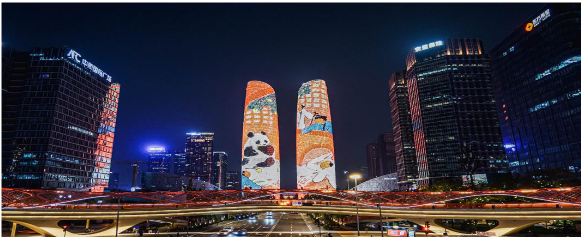
6. BIG PARADISE เงินดู-สิตรูณี-ต่ากุกลาเซียร์-จี้วี้โกว 6วัน5คืน (TG) on Aug – Dec 2026

กลางวัน รับประทานอาหารกลางวัน ณ ภัตตาคาร (พิเศษ สุกี้หม่าล่า) บ่าย นำท่านไปช้อปปิ้งที่ศูนย์การค้าที่ใหญ่ที่สุดในเอเชีย SKP Chengdu และ GLOBAL CENTER เทียบขนาด ประมาณ 20 ซิตินีโอเปราเฮาส์ หรือ 3 เท่าของเพนตากอน เป็นศูนย์รวมความบันเทิงแห่งใหม่ในเมืองเฉิงตู ประกอบด้วยหมู่บ้านเมดิเตอร์เรเนียน สวนน้ำ ลานสเก็ตน้ำแข็ง โรงหนัง ศูนย์การค้า และโรงแรมจำนวนมาก ครบวงจรฯ ในอาคารเดียว ใหญ่โตมหึมาจริงๆ นำท่าน ชมวิวกกลางคืนถ่ายรูปลูตึกแฝดเทียนฟู่ (ด้านหน้า) จุดแลนด์มาร์คสำคัญเมืองเฉิงตูเป็นสองอาคารคู่แฝดที่อยู่ติดกัน ทรงแปลกตา เป็นตึกของศูนย์การเงินระหว่างประเทศเทียนฟู่ ซึ่งมีส่วนในการสร้างสนามบินเฉิงตู เทียนฟู่ และยัง