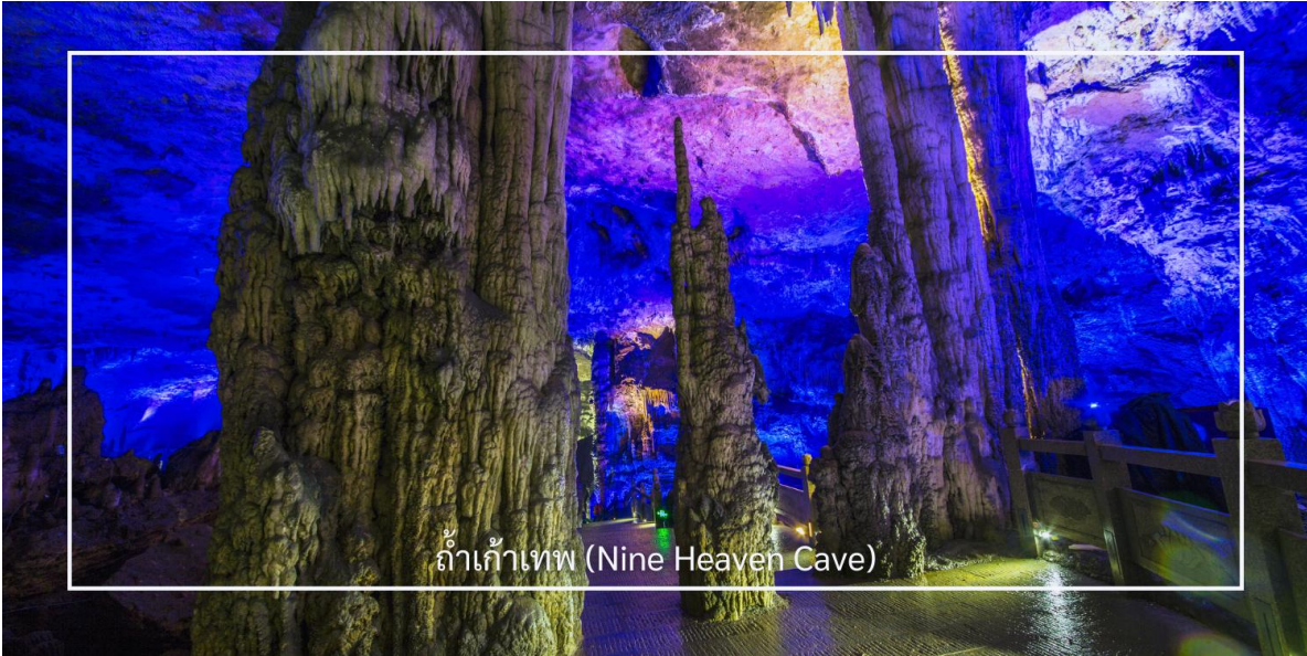
ถ้ำเก้าเทห์ (Nine Heaven Cave)

** ชำระค่าทัวร์ในนามบริษัท ไลออน ทราเวล จำกัด เท่านั้น **