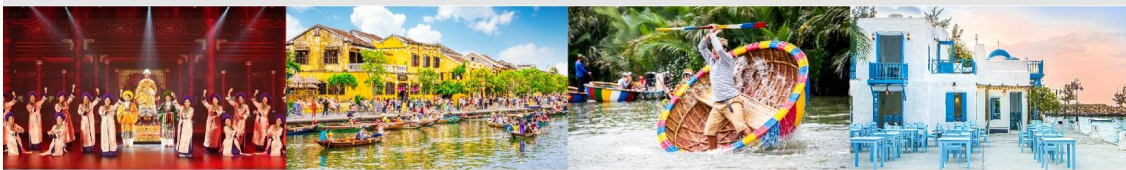
The Heritage Show เมืองโบราณฮอยอัน เรือกระดัง Marina Café *ทางบริษัทฯ ขอสงวนสิทธิ์ในการสลับโปรแกรมทัวร์ตามความเหมาะสมขึ้นอยู่กับสถานการณ์หน้างาน โดยคำนึงถึงผลประโยชน์ของลูกค้าเป็นสำคัญ

** ชำระค่าทัวร์ในนามบริษัท ไลออน ทราเวล จำกัด เท่านั้น **