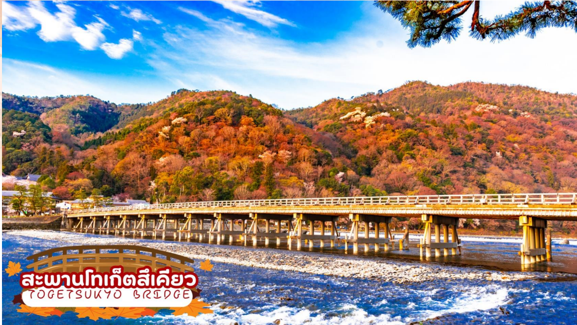
สะพานโทเก็ตสึเกียว TOGETSUKYO BRIDGE

** ชำระค่าทัวร์ในนามบริษัท ไลออน ทราเวล จำกัด เท่านั้น **