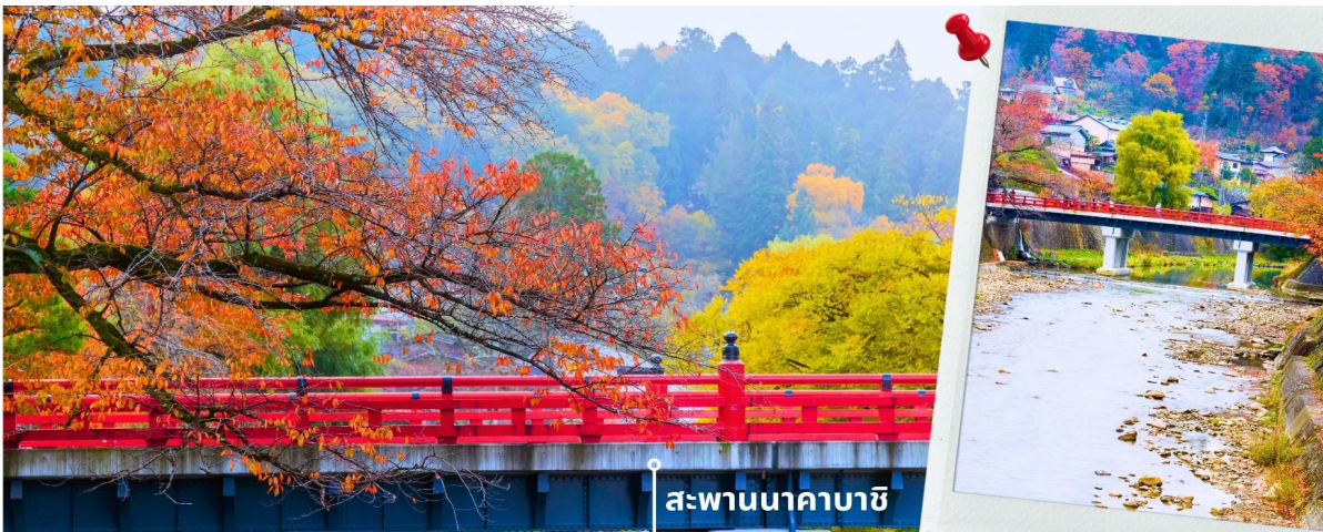
สะพานนาคาบาชิ

จากนั้นนำท่านเดินทางสู่ เมืองทาเคยาม่า ซึ่งเป็นเมืองเล็กๆ ที่ตั้งอยู่ในจังหวัดกิฟุ ที่หอมล้อมไปด้วยภูเขาและธารน้ำใส พาท่านแวะถ่ายรูปและชมวิวที่ สะพานนาคาบาชิ เป็นสะพานที่สามารถเห็นได้ชัดอย่างโดดเด่นจากสีที่แดงเข้ม อีกทั้งสะพานแห่งนี้ยังถือเป็นสัญลักษณ์ที่สำคัญจุดหนึ่งของเมือง โดยเฉพาะใบไม้เปลี่ยนสีที่จะมีใบไม้สีสดใสใสสะอาดอยู่รายล้อมตัวสะพาน จนกลายเป็นจุดชมวิวยอดนิยมแห่งหนึ่งของเมืองทาเคยาม่า