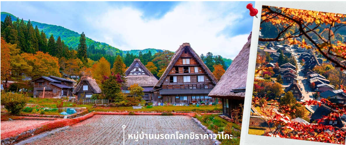
หมู่บ้านมรดกโลกชิราคาวาโกะ

จากนั้นนำท่านเดินทางสู่ เมืองกิฟุ พาท่านเข้าชม หมู่บ้านมรดกโลกชิราคาวาโกะ หมู่บ้านแห่งนี้ ตั้งอยู่ในหุบเขาสูงห่างไกลความเจริญ ทำให้ยังรักษามรดกวัฒนธรรม ประเพณีอันดั้งเดิมไว้ได้อย่างสมบูรณ์ และเป็นหมู่บ้านที่มีรูปร่างแปลกตาติดอันดับ ซึ่งได้ชื่อว่าเป็น The most beautiful village in Japan โดยมีบ้านทรงแบบ “กัสโซสึคิ” ซึ่งเป็นบ้านชาวนาโบราณที่มีอายุมากกว่า 250 ปี คำว่า กัสโซ มีความหมายว่า พนมมือ ซึ่งคล้ายกับรูปแบบของบ้านที่มีหลังคามุงด้วยฟางข้าวที่ทำมุมชันถึง 60 องศา ราวกับสองมือที่ประนมเข้าหากัน ตัวบ้านมีความยาวประมาณ 18 เมตร กว้าง 10 เมตร ทั้งหลังถูกสร้างขึ้นโดยไม่ใช้ตะปู ภายหลังในปี 1995 ได้รับการตั้งขึ้นเป็นมรดกโลก