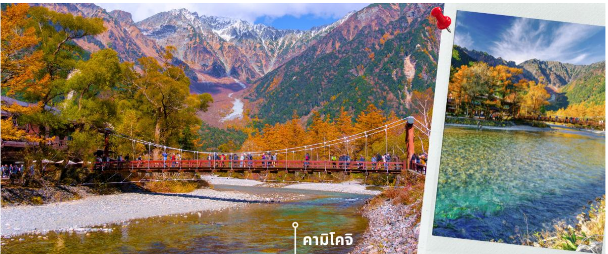
*ระยะเวลาการเปลี่ยนสีของใบไม้จะขึ้นอยู่กับสายพันธุ์และสภาพอากาศ*

เช้า รับประทานอาหารเช้าที่ โรงแรม (4) หลังรับประทานอาหารเช้า นำท่านเดินทางชม ความสวยงามของธรรมชาติสุดอลังการ อยู่ไม่ไกลจากเทือกเขาเจแปนแอลป์ ดินแดนสายน้ำกลางหุบเขา คามิโคจิ Kamikochi ตั้งอยู่ระหว่าง เมืองมัตสึโมโตะ (Matsumoto) และทาคายามา (Takayama) เป็นสถานที่ยอดฮิตอีกจุดหนึ่ง ที่นักท่องเที่ยวนิยมมาเยี่ยมชม โดยที่นี่จะมีความสวยงามแตกต่างกันออกไปในแต่ละฤดูกาล เช่น ฤดูใบไม้ผลิ ภายในอุทยานฯ อาจยังมีหิมะหลงเหลืออยู่บ้าง และต้นไม้เริ่มเปลี่ยนเป็นสีเขียวชอุ่มพร้อมกับอุณหภูมิที่อบอุ่นขึ้น, ฤดูร้อนอากาศยังเย็นสบาย เนื่องจากอยู่ที่สูงและล้อมรอบด้วยป่าเขา เป็นฤดูกาลแห่งการปีนเขา ถือเป็นช่วงพีค นักท่องเที่ยวนิยมมาเดินป่ากัน, ฤดูใบไม้ร่วง อีกหนึ่งช่วงพีคที่นักท่องเที่ยวจะมาชมความงามของใบไม้เปลี่ยนสี ซึ่งแต่ละปีก็จะเปลี่ยนแปลงไปตามสภาพอากาศ ส่วนในช่วงฤดูหนาว ทางอุทยานจะทำการปิดเพื่อฟื้นฟูธรรมชาติก่อนจะกลับมาเปิดให้บริการอีกครั้งในช่วงฤดูร้อน และอีกจุดไฮไลท์ของที่นี่คือ สะพานกัปปะบาชิ Kappa Bridge เป็นสะพานแขวนที่สร้างจากไม้พาดข้ามแม่น้ำอะซุสะ ด้วยความยาวประมาณ 36 เมตร สามารถมองเห็นทัศนียภาพที่สวยงามของภูเขาโฮตะ ให้ท่านได้เดินเที่ยวชม และเก็บภาพบรรยากาศความสวยงามตามอัธยาศัย