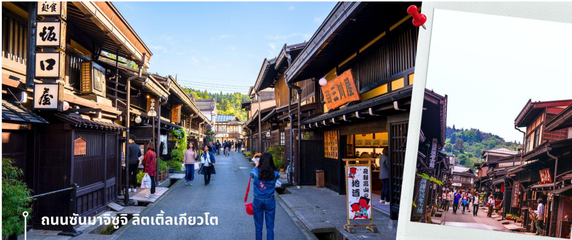
ถนนซันมาจิซุจิ ลิตเติ้ลเกียวโต

จากนั้นให้เวลาท่านเดินเล่นสัมผัสบรรยากาศกันต่อที่ ถนนซันมาจิซุจิ ซึ่งถูกขนานนามว่าเป็น “ลิตเติ้ลเกียวโต” บ้านไม้โบราณโชน้ำตาลดำ เรียงรายไปตามทางเดิน มีคูน้ำอยู่รอบเมือง ปัจจุบันได้มีการปรับเปลี่ยนเป็นร้านค้า ร้านอาหารของที่ระลึก สำหรับนักท่องเที่ยวให้ได้เลือกชมทั้ง ผ้าแฮนด์เมด ชุดยูกาตะ ตุ๊กตาซารุโอะโอะ