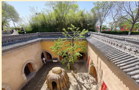
A-XIYO1A TRAIL OF THA KONG ชื่ออัน ลี้วหยาง หยวินชิวซาน 6วัน5คืน(ZH)ก.ค.-ต.ค. 69