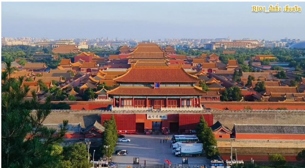
BJ01_ปักกิ่ง เมืองจีน

ด้านทิศเหนือ คือ ประตูเทียนอันเหมิน (ประตูสันติภาพสวรรค์) ที่มีรูปพอร์ตเทรตขนาดใหญ่ของประธานเหมา เจ๋อตง ติดอยู่ ซึ่งเป็นทางเข้าสู่ พระราชวังต้องห้าม จัตุรัสนี้เป็นสถานที่ประกาศสถาปนาสาธารณรัฐประชาชนจีนในปี 1949 และเป็นพื้นที่จัดพิธีสวนสนามทางทหารที่แสดงแสนยานุภาพของจีนมาโดยตลอด นับเป็นจุดท่องเที่ยวสุดอลังการและสถานที่บันทึกหน้าประวัติศาสตร์การเมืองที่เข้มข้นที่สุดของจีน จากนั้นนำท่านไปชมวิวทะเลกับ “พระราชวังกู่กง” (GUGONG) หรือที่รู้จักกันในชื่อ พระราชวังต้องห้าม (Forbidden City) คือแลนด์มาร์คที่สำคัญที่สุดแห่งหนึ่งของประเทศจีนเป็นสถานที่ท่องเที่ยวระดับ 5A และได้รับการรับรองเป็นมรดกโลกจาก UNESCO เป็นพระราชวังโบราณกว่า 600 ปี ทั้งเป็นที่ประทับของจักรพรรดิในสมัยราชวงศ์หมิงและราชวงศ์ชิง รวมทั้งสิ้น 24 พระองค์ พื้นที่กว่า 720,000 ตารางเมตร มีห้องรวมกันเกือบ 10,000 ห้อง จนได้รับการยกย่องว่าเป็นหนึ่งในพระราชวังที่สวยงามที่สุดในโลก