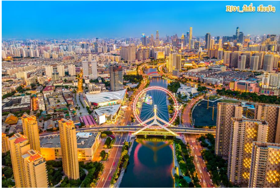
BJ01_ปักกิ่ง เบijing

** ชำระค่าทัวร์ในนามบริษัท ไลออน ทราเวล จำกัด เท่านั้น **