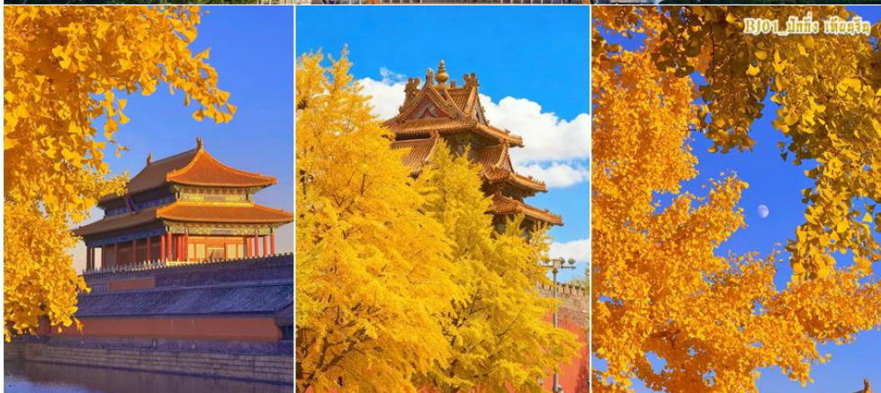
BJ01_ปักกิ่ง เมืองจีน

** ชำระค่าทัวร์ในนามบริษัท ไลออน ทราเวล จำกัด เท่านั้น **