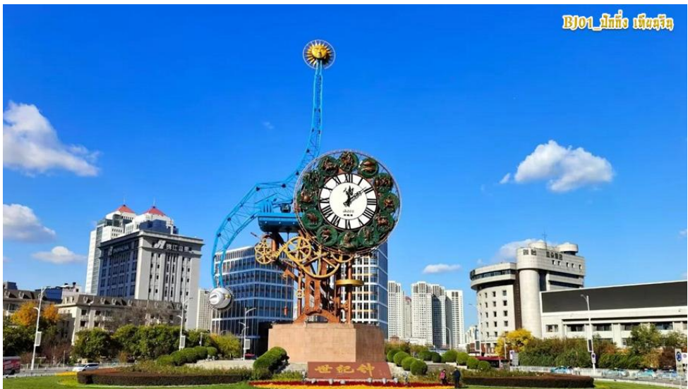
BJ01_ปักกิ่ง เบijing

จากนั้นนำท่านไปชม “หอนาฬิกาแห่งศตวรรษ” (BEIJING CENTURY CLOCK) แลนด์มาร์คสำคัญเมืองเทียนจิน ที่มีการออกแบบที่สวยงามสไตล์ยุโรปผสมผสานสถาปัตยกรรมจีนตีไซนโดตเด่น ถือว่าเป็นประติมากรรมเหล็กขนาดใหญ่ ริมแม่น้ำไห่เหอ สร้างขึ้นเมื่อ ค.ศ. 2000 เพื่อเฉลิมฉลองศตวรรษใหม่ โดดเด่นด้วยการออกแบบสไตล์ยุโรปผสมผสานศิลปะจีน (รูปทรงตัว S สื่อถึงหยิน-หยาง) โครงสร้างเหล็กสูง 40 เมตร สีดำ พร้อมสัญลักษณ์ 12 ราศี และหน้าปัดเลขโรมัน เป็นสัญลักษณ์ที่เชื่อมโยงประวัติศาสตร์อันยาวนานของจีนเข้ากับโลกยุคใหม่