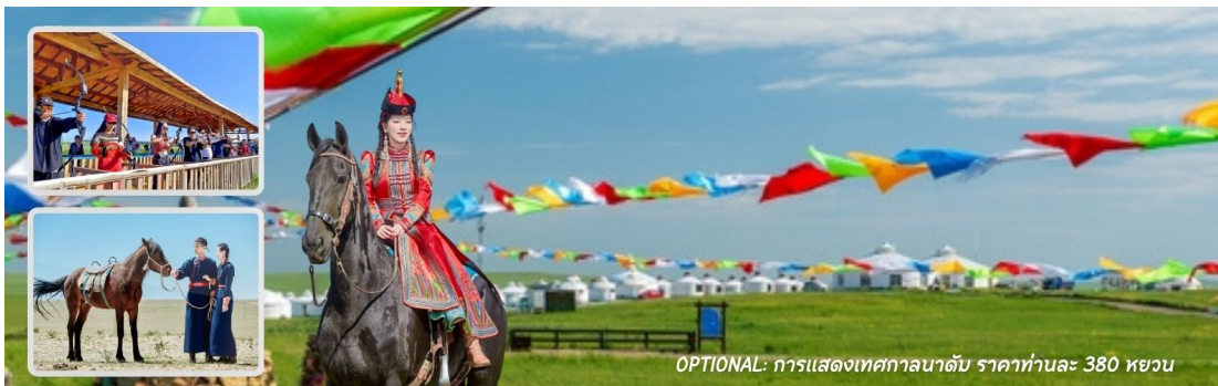
OPTIONAL: การแสดงเทศกาลนาดัม ราคาท่านละ 380 หยวน

หมายเหตุ : บางกิจกรรมอาจมีการเปลี่ยนแปลงโดยไม่ได้แจ้งให้ทราบล่วงหน้า ทั้งนี้ขึ้นอยู่กับสภาพภูมิอากาศในแต่ละปี รบกวนสอบถามกับทางไกด์ท้องถิ่น หรือหัวหน้าทัวร์ให้ละเอียดก่อนการตัดสินใจซื้อ