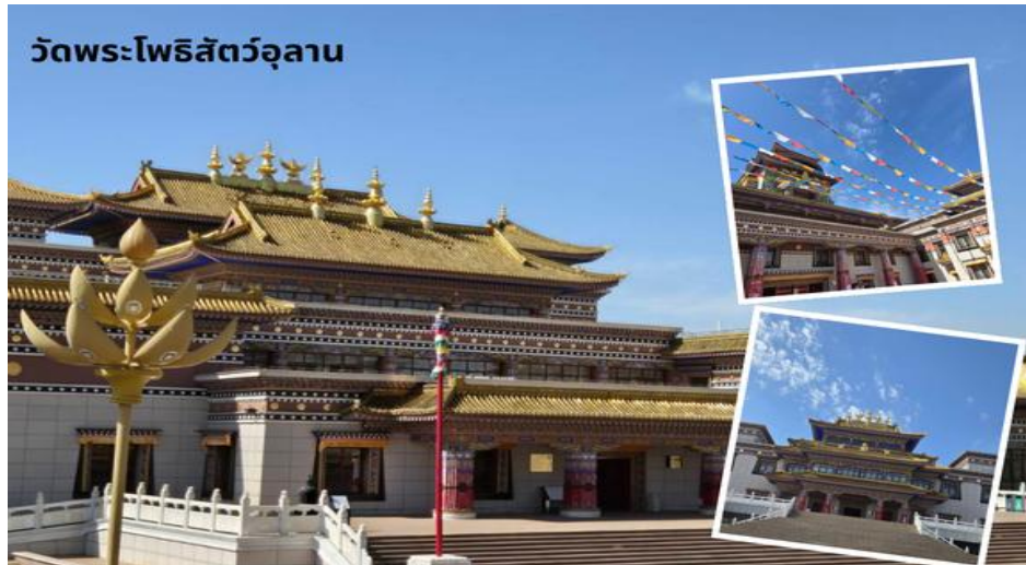
วัดพระโพธิสัตว์อูลาน

จากนั้นนำท่านสู่ วัดพระโพธิสัตว์อูลาน เป็นสถานที่ท่องเที่ยวระดับ 4A ครอบคลุมพื้นที่ประมาณ 20,000 ตารางเมตร รูปแบบอาคารเป็นสถาปัตยกรรมแบบผสมผสานมองโกล ทิเบต และจีน ภายในมีการจัดแสดงโบราณวัตถุทางวัฒนธรรมที่ยังคงมีความสมบูรณ์