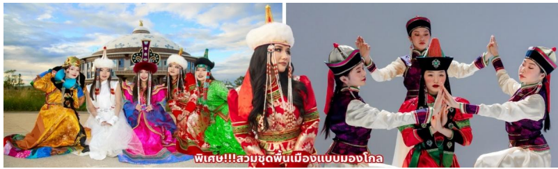
พิเศษ!!!สวมชุดพื้นเมืองแบบมองโกล

** ชำระค่าทัวร์ในนามบริษัท ไลออน ทราเวล จำกัด เท่านั้น **