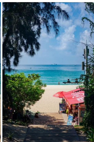
อ่าวย่าหลง