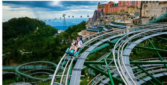
2UDAD-VZ012 เวียดนามกลาง เที่ยวบินจาก จุฬาลงกรณ์มหาวิทยาลัย ดานัง ฮอยอัน พัkbานาฮิลล์ 1 คืน พัkbานัง 2 คืน 4 วัน 3 คืน โดยสายการบิน Thai Vietjet Air (VZ) Update 05 JUN 26