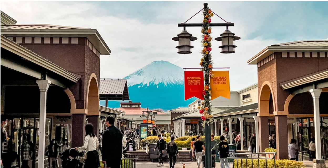
TF-NRTXJ01 โตเกียว คาวาโกเอะ ไปไม่เปลี่ยนสี โอโมงคิโบเมเบิล ถนนคันทันแะก๊วย แซออนเซ็น 2 คืน 5วัน 3คืน Air Asia X (XJ) หน้า 1 of 16

10.45 น. ถึงสนามบินเมืองนาริตะ หลังผ่านพิธีการตรวจคนเข้าเมืองเรียบร้อยแล้ว จากนั้นแต่ละท่านรับกระเป๋าสัมภาระที่ โหลดตรวจเช็คให้เรียบร้อย (ประเทศญี่ปุ่นเวลาเร็วกว่าไทย 2 ชั่วโมง) เที่ยง บริการอาหารเที่ยง ณ ภัตตาคาร (มื้อที่ 1) เมนูพิเศษ : บุฟเฟ่ต์ปิ้งย่าง Yakiniiku นำท่านช้อปปิ้งที่ โกเทมบะ พรีเมียม เอาท์เล็ต (Gotemba premium outlets) ที่ใหญ่ที่สุดในญี่ปุ่น ภายในมีร้านค้ามากมายกว่า 200 ร้านค้า และยังมีศูนย์อาหาร เป็นแหล่งรวมสินค้าพรีเมียม ซึ่งมีทั้งแบรนด์ในประเทศ และแบรนด์จากต่างประเทศ ไม่ว่าจะเป็นเสื้อผ้าแฟชั่น อุปกรณ์กีฬา เครื่องใช้ในครัวเรือน และสินค้าอิเล็กทรอนิกส์ และอื่นๆอีกมากมาย ที่นี้ได้รับความนิยมเป็นอย่างมากสำหรับนักท่องเที่ยว เพราะหากในวันที่ฟ้าสดใส จะสามารถมองเห็นภูเขาไฟฟูจิได้อย่างชัดเจน