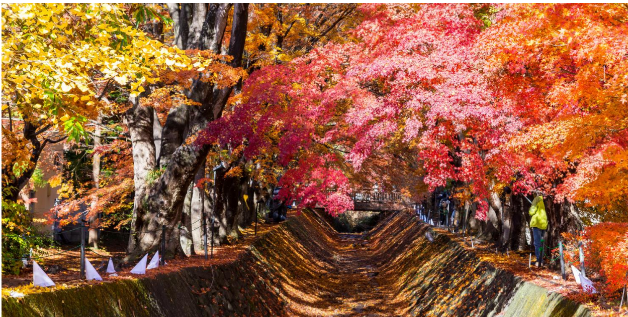
TF-NRTXJ01 โตเกียว คาวาโกเอะ ใบไม้เปลี่ยนสี อุโมงิโอบะเมเปิ้ล ถนนต้นแปะก๊วย แช่ออนเซ็น 2 คืน 5วัน 3คืน Air Asia X (XJ) หน้า 1 of 16

จากนั้นนำท่านเดินทางสู่ “อุโมงิโอบะเมเปิ้ล โมมิจิ ไคโร” (Momiji Kairo) ณ ริมหะเลสาบคาวากูจิโกะ หนึ่งในจุดชมใบไม้เปลี่ยนสีที่งดงามและมีชื่อเสียงที่สุดของญี่ปุ่น ในช่วงฤดูใบไม้ร่วง ต้นเมเปิ้ลที่เรียงรายตลอดสองข้างทางจะพร้อมใจกันเปลี่ยนสีเป็นแดง ส้ม และเหลืองทอง สร้างเป็นอุโมงิโอบะเมเปิ้ลที่สวยงามสุดโรแมนติก ท่วมท้นบรรยากาศเย็นสบายและวิ