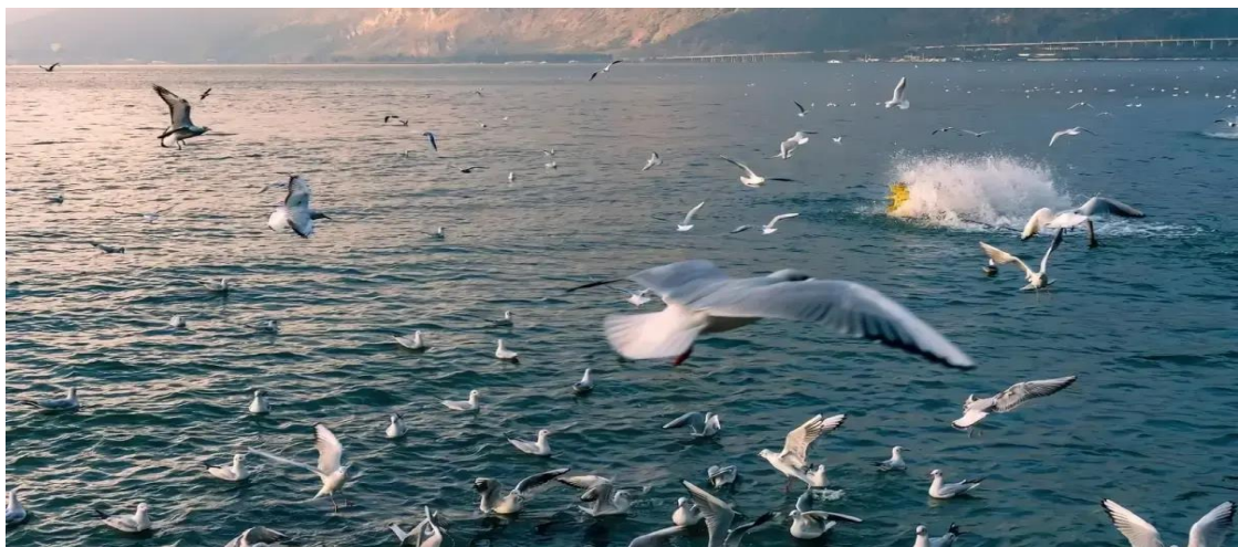
2UKMG-FD004 คุนหมิง ตงชาน ภูเขาหิมะเจียวจื่อ สีสันแห่งฤดูใบไม้เปลี่ยนสี 6 วัน 5 คืน *ไม่ลงร้าน* BY (FD)

นำท่านชม ทะเลสาบเตียนฉือ หรือเรียกอีกชื่อหนึ่งว่า ทะเลสาบคุนหมิง บ่อน้ำคุนหมิง ทะเลสาบเตียนหนาน และเตียนไท่ ทะเลสาบแห่งนี้อยู่ในเขตตะวันตกเฉียงใต้ของเมืองคุนหมิง มณฑลยูนนาน มีแม่น้ำพันหลงและแม่น้ำสายอื่นๆ ไหลลงสู่ทะเลสาบ พื้นผิวทะเลสาบอยู่สูงจากระดับน้ำทะเล 1,886 เมตร ครอบคลุมพื้นที่ 330 ตารางกิโลเมตร ถือเป็นทะเลสาบน้ำจืดที่ใหญ่ที่สุดในมณฑลยูนนาน และได้รับการขนานนามว่าเป็นไข่มุกแห่งที่ราบสูง ระดับน้ำลึกเฉลี่ย 5 เมตร และลึกที่สุด 11 เมตร น้ำในทะเลสาบไหลออกมาทางปากแม่น้ำทางตะวันตกเฉียงใต้ เรียกว่า แม่น้ำตึกแต่น ซึ่งเป็นต้นน้ำของแม่น้ำปู้ฉู่ ซึ่งเป็นสาขาของแม่น้ำจินซา ซึ่งเป็นแม่น้ำสายหลักในตอนบนของแม่น้ำแยงซี ทะเลสาบเตียนฉือมีทัศนียภาพที่สวยงาม ทุกฤดูหนาว นกนางนวลปากแดงหลายหมื่นตัวจะมาที่นี่ เพื่อใช้เวลาช่วงฤดูหนาวและหาอาหาร นกนางนวลเหล่านี้มักจะบินวนเวียนอยู่กลางอากาศหรือ ล่องลอยเล่นน้ำในทะเลสาบ ช่วยเพิ่มสีสันให้กับเมืองแห่งฤดูใบไม้ผลิในฤดูหนาว หากต้องการถ่ายภาพสวยๆ