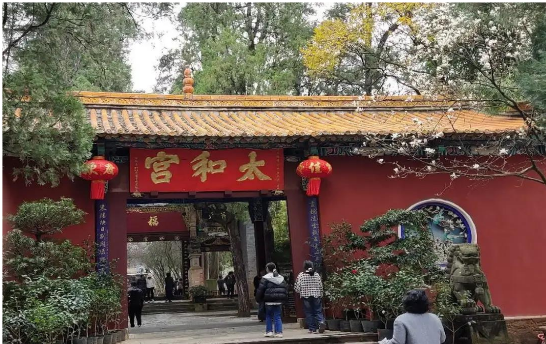
2UKMG-FD004 คุหมิง ตงชวน ภูเขาหิมะเจียวจื่อ สีสันแห่งฤดูใบไม้เปลี่ยนสี 6 วัน 5 คืน *ไม่ลงร้าน* BY (FD)

วันแรก กรุงเทพฯ (สนามบินดอนเมือง) – कुหมิง (ท่าอากาศยานนานาชาติคุหมิงฉางสุ่ย) (FD582 : 08:00 - 12:25) – ตำนกทองจินเตียน-สวนน้ำตกคุหมิง 05.00 น. พร้อมกันที่ ท่าอากาศยานดอนเมือง อาคารผู้โดยสารระหว่างประเทศเคาน์เตอร์ สายการบินแอร์เอเชีย (FD) โดยมีเจ้าหน้าที่คอยให้การต้อนรับและอำนวยความสะดวกตรวจเช็คสัมภาระและเอกสารการเดินทางให้กับทุกท่าน 08.00 น. ออกเดินทางสู่ คุหมิง ประเทศจีน โดยเที่ยวบินที่ FD582 * น้ำหนักกระเป๋า 20 กิโลกรัม/ท่าน * ไม่มีอาหารบริการบนเครื่อง (ท่านสามารถเลือกซื้อได้ที่พนักงานบริการบนเครื่องบิน) 12.25 น. เดินทางถึง ท่าอากาศยานนานาชาติคุหมิงฉางสุ่ย เมืองเอกและเป็นเมืองที่ใหญ่ที่สุดในมณฑลยูนนานมีประชากร 33 ล้านคน โดยเป็นชนกลุ่มน้อยถึง 24 เผ่าครอบคลุมพื้นที่ถึง 15,561 ตารางกิโลเมตร อยู่สูงเหนือระดับน้ำทะเลประมาณ 2,000 เมตร คุหมิงได้ชื่อว่าเป็นเมืองแห่งฤดูใบไม้ผลิ เพราะมีภูมิอากาศที่เย็นสบายตลอดทั้งปี ไม่ร้อนหรือหนาวจนเกินไปแล้ว สิ่งที่มีเสน่ห์ดึงดูดนักท่องเที่ยวก็คือธรรมชาติที่สวยงาม ผ่านพิธีการตรวจคนเข้าเมือง กลางวัน รับประทานอาหารกลางวัน ณ ภัตตาคาร (มื้อที่ 1) นำท่านชม วิหารทองเหลือง หรือ ตำนกทองจินเตียน ตั้งอยู่บนภูเขา หมิงฟงซาน ด้านทิศตะวันออกของตัวเมืองคุหมิง สร้างขึ้นในสมัยราชวงศ์หมิง และเป็นบ้านเก่าของอู๋ซานกั๋ว แม่ทัพคนสุดท้ายของราชวงศ์หมิง ชาวจีนว่ากันว่า เป็นวิหารที่สร้างด้วยทองเหลืองใหญ่ที่สุดในโลก รวมทั้งสายมูอย่าพลาด ไปโกยเงินใส่กระเป๋าอยู่ด้านหลังวิหารทองเหลือง ชาวจีนบอกว่า เงินทองไหลมาเทมา ปังสุดๆ และเคล็ดการบูชาของมงคลแบบจีน