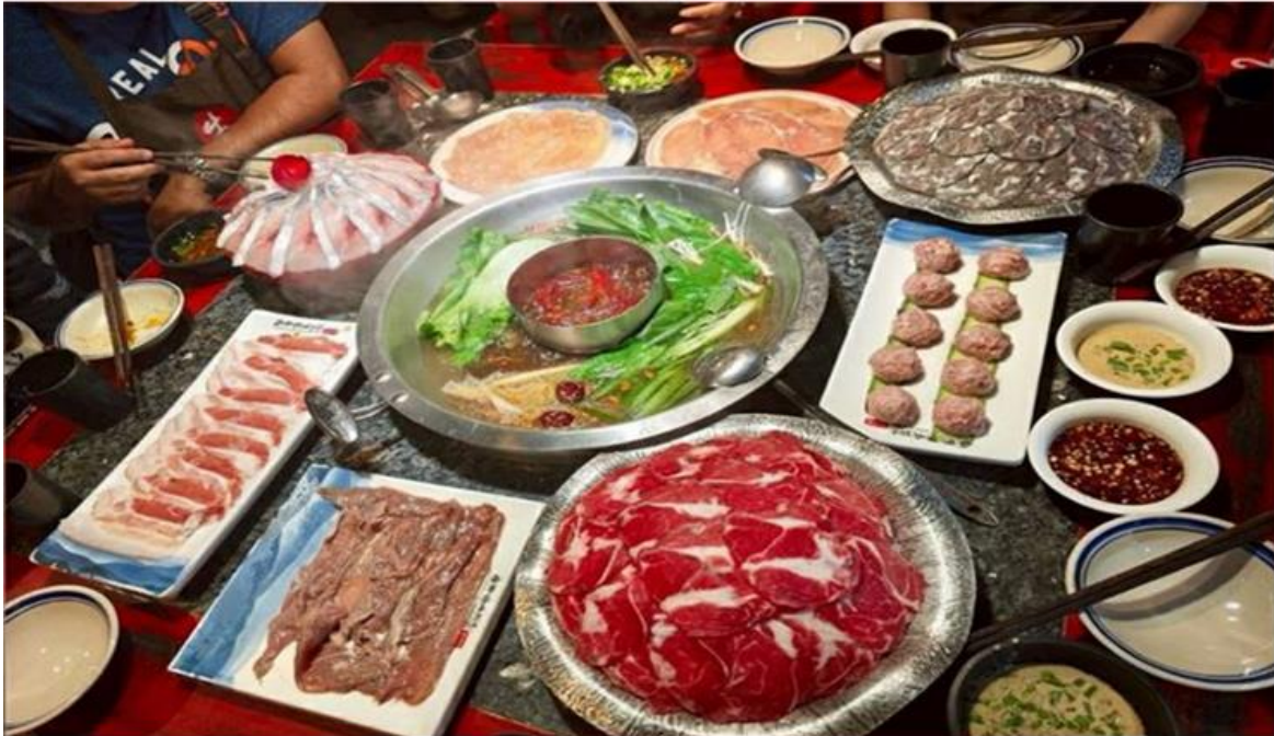
คำ รับประทานอาหารค่ำ ณ ภัตตาคาร (เมื่อที่ 12) *เมนูพิเศษสุกี้หม่าล่าเสฉวน

ดั้งเดิม มีทั้งแบรนด์แฟชั่นระดับโลกอย่าง Gucci, Chanel, Balenciaga รวมถึงร้านค้าไลฟ์สไตล์และแฟชั่นท้องถิ่น อาหารท้องถิ่นและคาเฟ่นานาชาติสวยๆ ที่เหมาะสำหรับการนั่งพักผ่อน