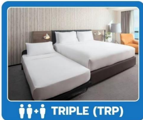
👤👤👤 TRIPLE (TRP)

**รูปภาพห้องพักเป็นเพียงภาพสื่อถึงประเภทของเตียงเท่านั้น ไม่ใช่ภาพห้องพักจริงสำหรับการเข้าพัก**