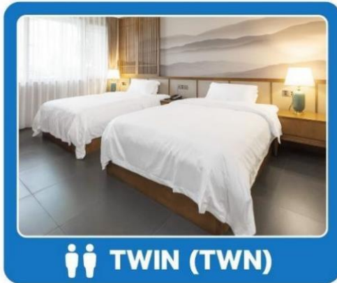
👤👤 TWIN (TWN)