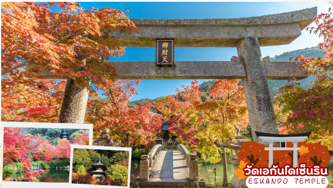
วัดเอกันโดเซ็นริน EIKANDO TEMPLE

นำท่านเดินทางสู่ วัดเอกันโดเซ็นริน (Eikando Temple) เป็นวัดพุทธศาสนานิกายโจโด (Jodo) หรือนิกายสุขาวดี ที่มีชื่อเสียงโด่งดังที่สุดแห่งหนึ่งในเกียวโต (Kyoto) ก่อตั้งขึ้นในปี ค.ศ. 863 ในช่วงสมัยเฮอัน เป็นวัดที่มี จุดชมใบไม้เปลี่ยนสีที่งดงามและโด่งดังที่สุดในเกียวโต จนได้รับฉายาว่า เอคันโดแห่งไบเมเปิ้ล ต้นเมเปิ้ลปกคลุมไปทั่วบริเวณวัดมากถึง 3,000 ต้น โดยใบไม้จะร่วงเต็มสวนในช่วงฤดูใบไม้ร่วง และถูกย้อมสีแดงและสีเหลืองผสมกัน แต่งแต้มสีกันไปทั่วบริเวณสวน ภายในบริเวณของวัดกว้างขวาง และมีจุดถ่ายรูปสวยๆ หลายมุม เช่น จุดถ่ายรูปยอดนิยมนที่มีสะพานโค้งและเงาสะท้อนของไบเมเปิ้ลสีแดงฉานบนผิวน้ำเจดีย์ทาโฮโด ( การเปลี่ยนสีของใบไม้ในฤดูใบไม้ร่วง ขึ้นอยู่กับสภาพอากาศ )