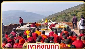
เทศกาลนวกฏ