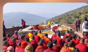
เขาคิชฌกูฏ