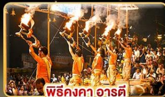
พิธีคังคา อารตี