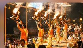
พิริยวงศาอารตี