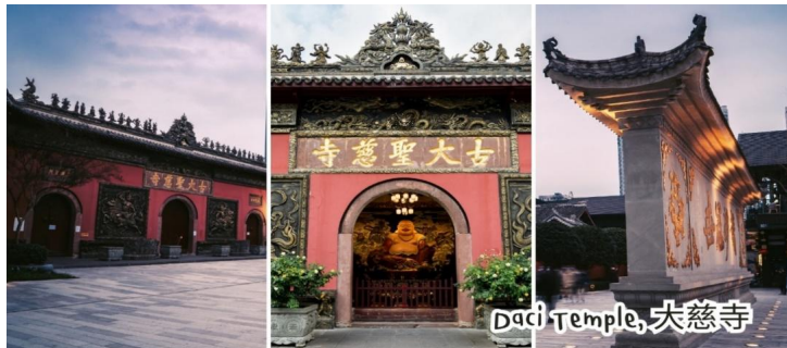
Daci Temple, 大慈寺

นำท่านแวะชมผลิตภัณฑ์สินค้าพื้นเมือง ร้านผ้าไหม จากนั้นนำท่านเดินทางสู่วัดต้าฉือ เป็นวัดพุทธนิกายมหายานเก่าแก่กว่า 1,600 ปี สร้างตั้งแต่ยุคราชวงศ์จิ้นตะวันตก รวมถึงเป็นสถานที่ที่วัดพระเสวียนจ่าง (พระถังซำจั๋ง) เคยจำพรรษาก่อนเดินทางไปชมพูทวีป ปัจจุบันนี้ได้มีโครงการอนุรักษ์อาคารบางส่วนและปรับปรุงพื้นที่รอบๆ ขึ้นโดยมีวัดเป็นศูนย์กลาง ติดกับย่านช้อปปิ้งทันสมัย