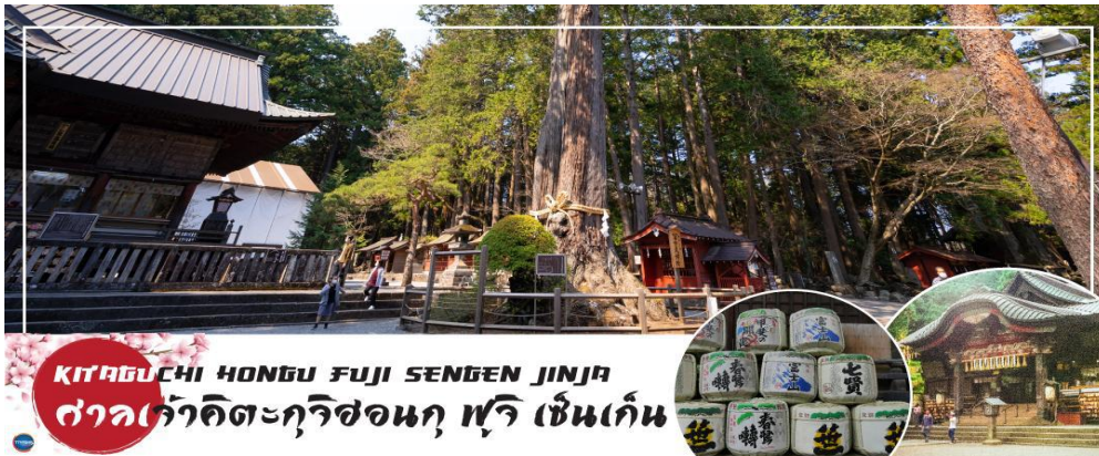
KITAGUCHI HONGU FUJI SENGGEN JINJA ศาลเจ้าอิชิเดเซนเกนฟูจิ เซนเก็น

นำท่านสักการะ ศาลเจ้าฟูจิโยชิเดเซนเกน (Fujiyoshida Sengen Shrine หรือ Kitaguchi Hongu Fuji Sengen Jinja) เป็นศาลเจ้าเซนเกนหลักที่ตั้งอยู่ทางทิศเหนือของภูเขาไฟฟูจิ ศาลเจ้าฟูจิโยชิเดเซนเกน ตั้งอยู่ในป่าทึบห่างไกลจากถนน จากถนนใหญ่เดินเข้ามาเรียงรายไปด้วยโคมไฟหิน และร่มเงาของป่าไม้สนซีดาร์สูงใหญ่ อาคารต่างๆภายในศาลเจ้าทาดะด้วยสีแดงตั้งแต่ปี 1615 เดิมทีศาลเจ้าแห่งนี้เป็นจุดเริ่มต้นสำหรับการปีนภูเขาไฟฟูจิจากทางทิศเหนือซึ่งตั้งอยู่ด้านขวาข้างหลังห้องโถงใหญ่ แต่มีจจุบันนักปีนเขาส่วนใหญ่หันไปเริ่มปีนจาก Fuji Subaru Line สถานีที่ 5